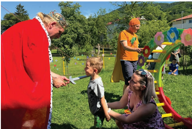
Červnové pasování školáčků.

A září je tu, ve školičce jsme přivítali i nové děti, a to nejen u malých Berušek, budeme dělat všechno pro to, aby se vám u nás líbilo, našly jste si nové kamarády a hlavně se vůbec