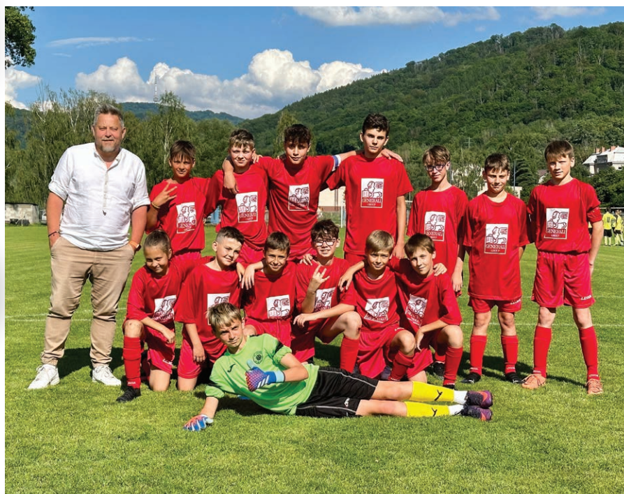
Nejlepší tým mladších žáků okresu Ústí nad Labem v loňské sezóně.