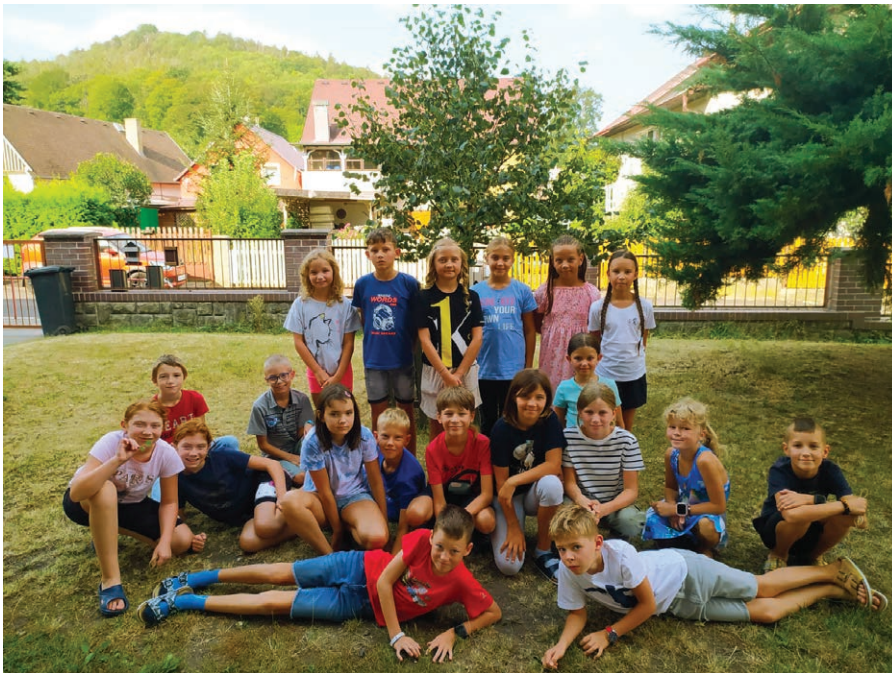
Čtvrťáci při měření lípy.