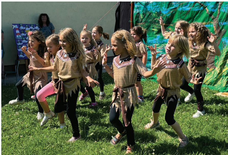
Taneční kroužek v akci.