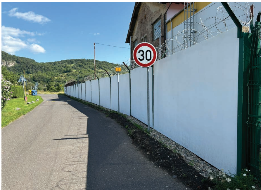
Společnost Heineken v průběhu léta opravila část nevzhledné zdi pivovaru v centru obce.