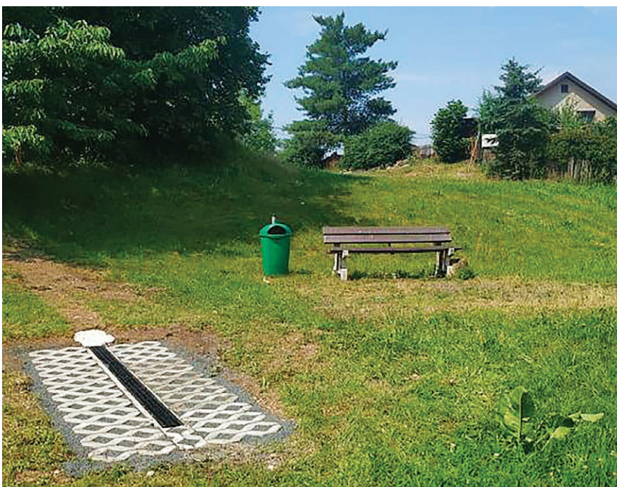
Nové vyústění svodu dešťové kanalizace nad pískovnou ve Valtířově.