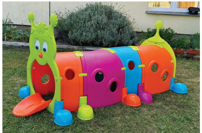
Nová prolézačka veselá housenka.