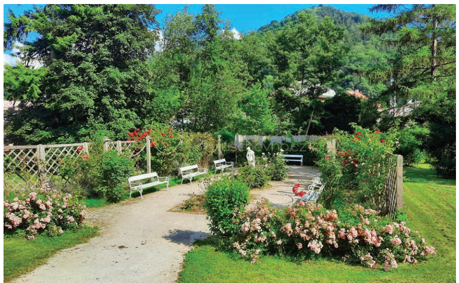
Růžová zahrada velkobřezenského zámku.