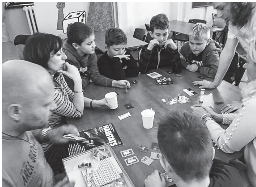
Dobry den vsem priznivcum deskovych her.

Ve čtyři jsme se začali pomalu balit (asi po 3 hodinách) a opět bylo slyšet – proč jsme tam byli takovou chvíličku?! (proti loňskému roku jsme přidali hodinu!) Někteří rodiče připustili, že možná o víkendu tam zajedou ještě jednou.