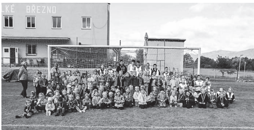
Snímek ze zářijového sportovního dne pořádaného pro školu a školku.

V polovině září jsme uspořádali sportovní den pro školku a nové prvňáčky. Poprvé jsme tuto akci uspořádali před třemi lety a zatím byla každý rok. Nejspíš se z toho stane tradice, stejně jako se stal turnaj přípravek O pohár obce Velké Březno, nebo pořádání pálení čarodějnic.