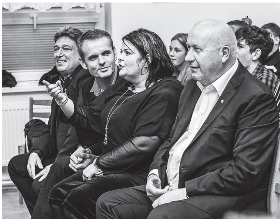
Významné osobnosti na křtu kalendáře pro dětský domov.

Děti z 5. A, B ZŠ ve Velkém Březně se zapojily do Projektu Abeceda s Českou spořitelnou. Projekt Abeceda peněz učí děti, jak fungují peníze a jak s nimi lépe hospodařit. Návštěva v bance, prohlídka bezpečnost-