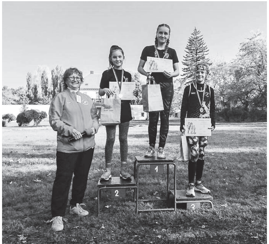
Úspěšné atletky z Velkého Března.

krát týdně, aby uspokojila všechny zájemce o krásný sport jménem atletika.