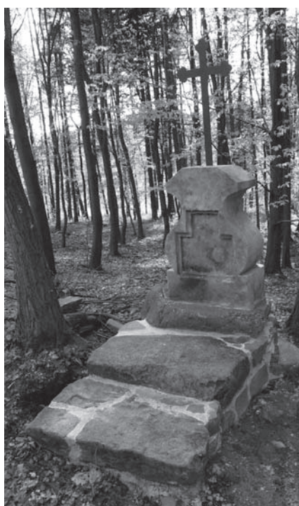
Obnovená Boží muka u rozcestí Fráží.