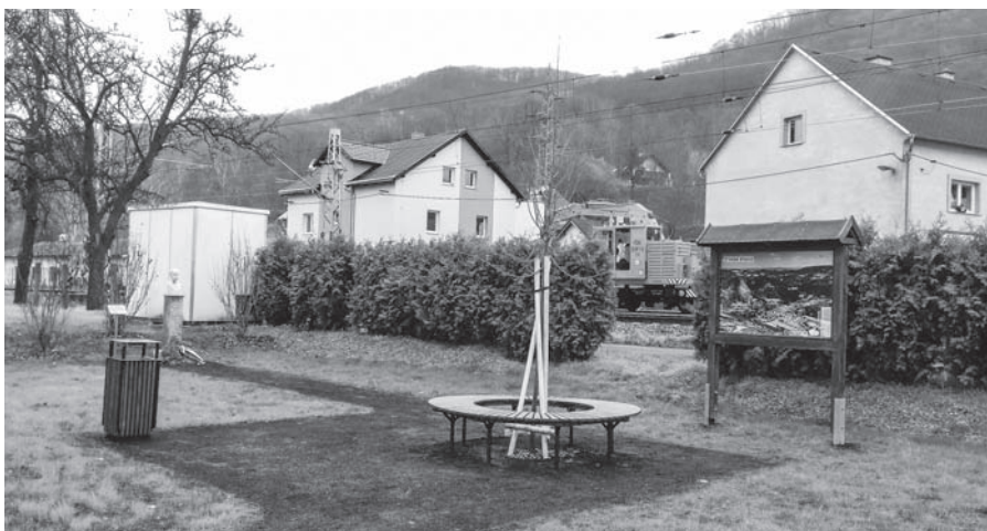
Nový parčík TGM ve Velkém Březně.