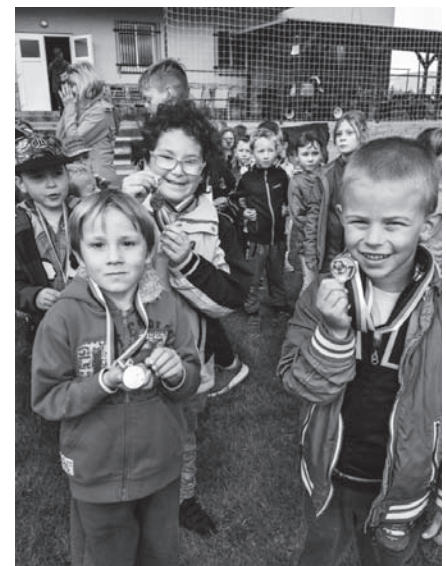
Snímek z akce „Můj první gól“.

Určitě jsme v září co nejvřeleji přivítali nové kamarády pohádkou „Hola, hola, školka volá!“, po seznámení je odměnili velkým potleskem a paní učitelky dárečkem. V dalších dnech na nás čekalo sportovní dopoledne, které pro nás připravil FK Jiskra Velké Březno. Při již tradiční akci „Můj první gól“ si děti vyzkoušely fotbalový trénink – slalom, střelbu na branku, rychlý sprint, sběr terčů, pohybové hry „Očásky“ a „Na vlka“, samotný fotbal a mnoho dalšího. Všechny děti si ze