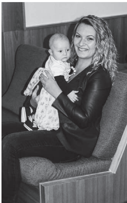
Snímek z vítání občánků.