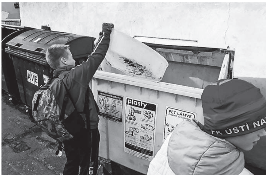
Děti se opět zúčastnily úklidu našeho okolí v rámci projektu „72 hodin“.