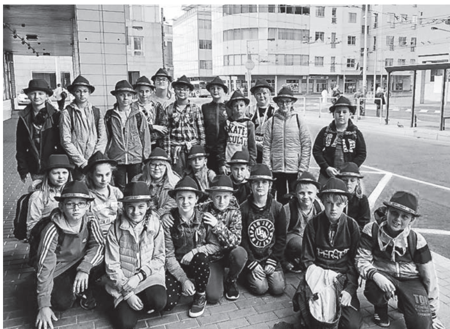
Děti se zúčastnily projektu „Abeceda peněz“, který směřuje k finanční gramotnosti.