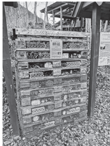
Hmyzí hotel ve Valtířově.