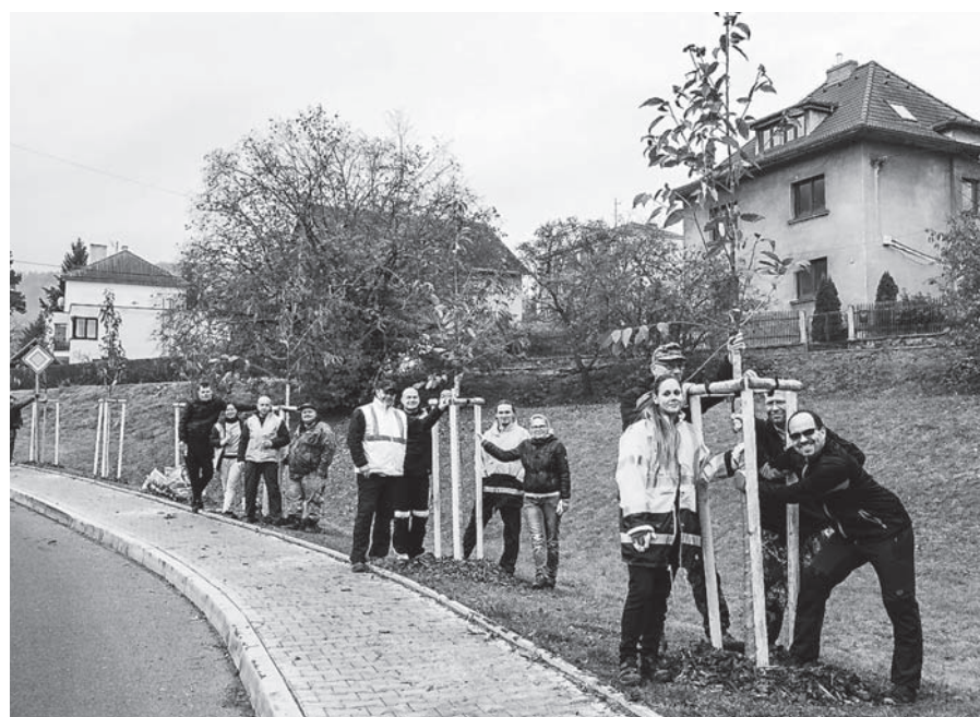
Výsadba nové aleje zaměstnanci pivovaru v Litoměřické ulici.