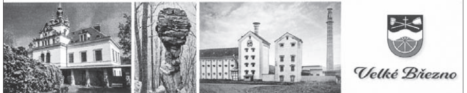
Nová pohlednice obce Velké Březno.