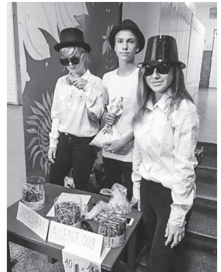
James Bat, agent 008 se vrátil...