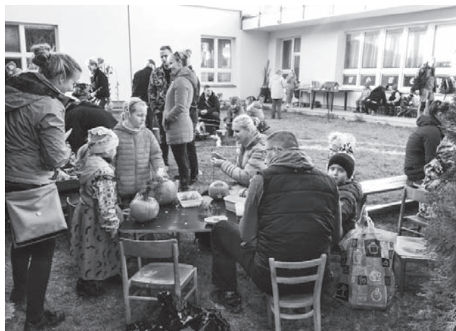
Dýňování v mateřské škole.

sportovního dopoledne odnášely spoustu zážitků a medaili na krčku. Přímo ve školce nás navštívila paní policistka s programem pro mateřské školky z oblasti prevence kriminality a dopravní výchovy. Při 1. setkání s názvem „Smíš – nesmíš“ se zaměřila na bezpečné chování při setkání s cizími lidmi (ještě nás čeká teoretická část z dopravní výchovy a na jaře praktická část na dopravním hřišti v Krásném Březně). Poslední zářijovou sobotu se dospěláci z mateřinky spolu s rodiči, dětmi a přáteli školy sešli na školní zahradě na podzimní brigádě. I přes ne zrovna vlídné počasí udělali spoustu práce – natřeli dřevěné hrací prvky, upravili bylinkovou zahrádku a keře, uhrabali a srovnali kačírky na dopadových plochách, opravili náš „vozový park“ a vyrobili zahradní knihobudku. Paní kuchařky pro všechny brigádníky připravily speciální podzimní polévku s pečivem a čaj.