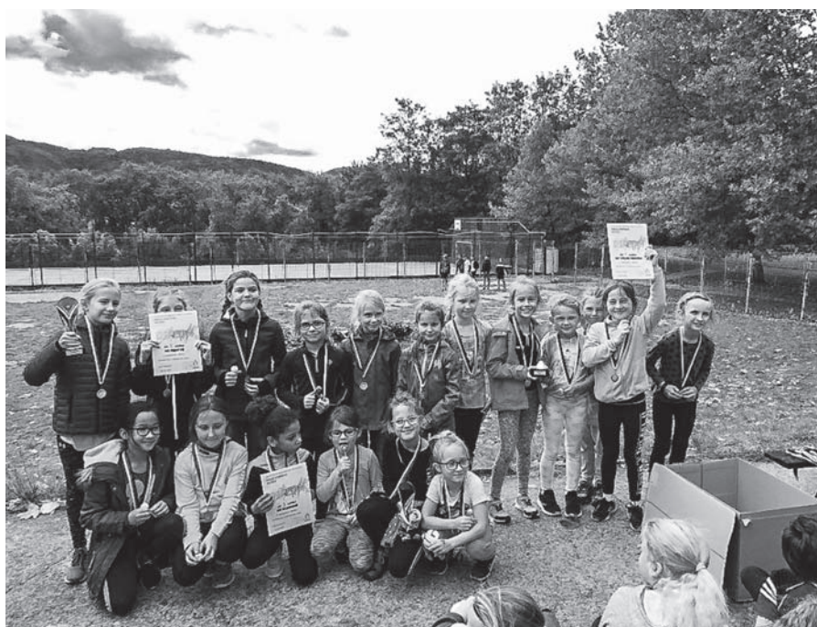
Účastníci „Spanilá jízdy v přespolním běhu“ na ZŠ Elišky Krásnohorské v Ústí nad Labem.