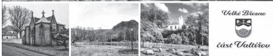
Nová pohlednice obce Valtířov.