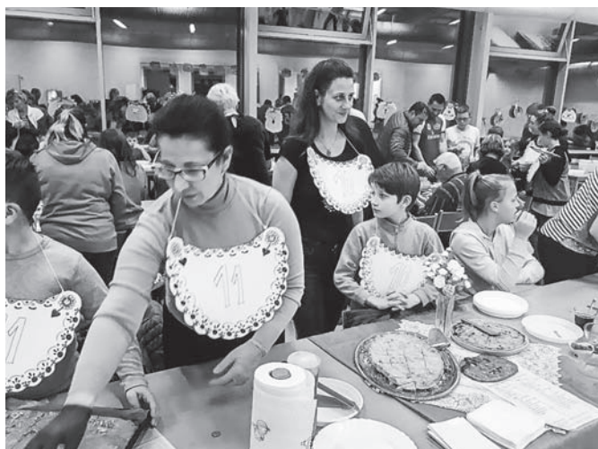
První velká akce ve školní jídelně byla spojena s dýňováním.