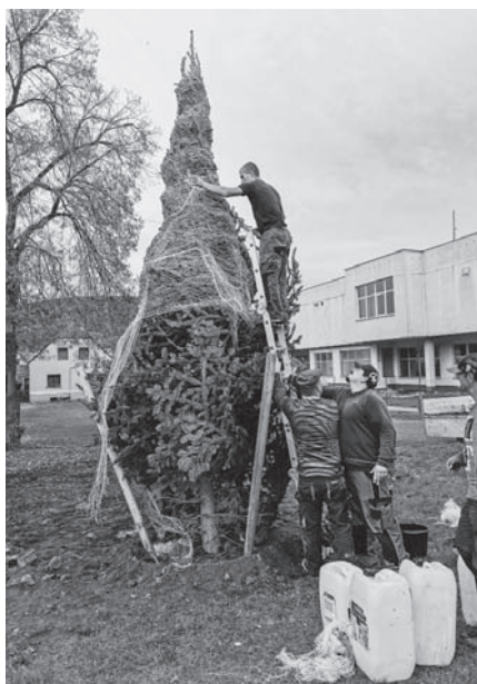
Výsadba kavkazské jedle.