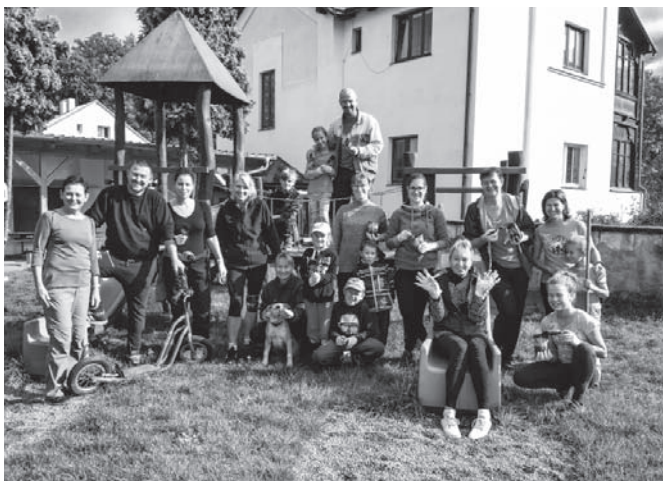
Snímek z brigády na školní zahradě.