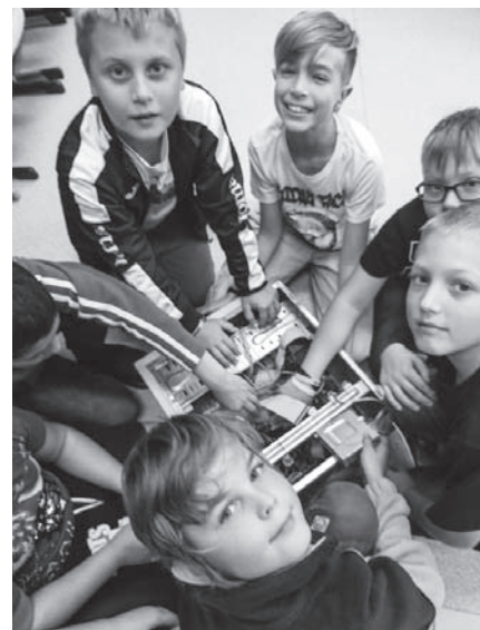
Tříděním odpadu chráníme přírodu.

Víte, co všechno se dá vyrobit z použitých baterií? Je toho hodně, protože ze 100 kg baterií získáme recyklací 65 kg kovonosných surovin. Nejvíce zinku, oceli a manganu, a dále také niklu, olovo, kadmium, kobalt, měď, a dokonce v malém množství i stříbro. Tyto kovy mají využití například ve stavebnictví, ale dají se z nich vyrobit třeba nové