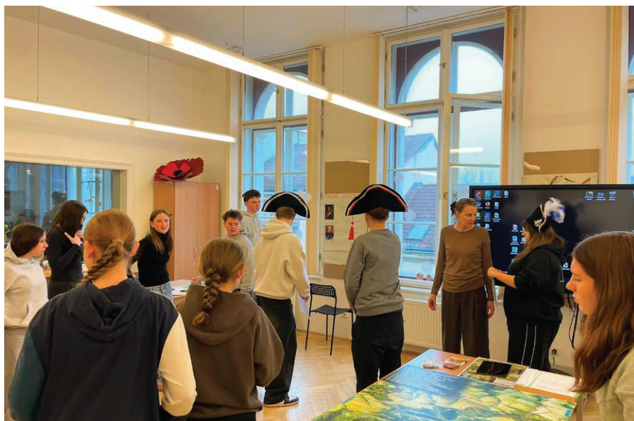
Dějepis trochu jinak v ústeckém muzeu.

Celý program byl nesmírně zábavný a interaktivní a hlavními aktéry byli samotní žáci. Rozdělení do týmů se vžili do rolí tehdejších panovníků a generálů a mohli tak prožít nejen samotnou bitvu, ale také její následky a situace,