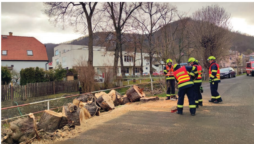
Kácení nebezpečného kaštanu v rámci prací pro naši obec.

Jednotka sboru dobrovolných hasičů Velké Březno zůstává i v současnosti personálně stabilní a plně připravená plnit své poslání. V současné době má jednotka 26 členů, z toho šest velitelů, jedenáct strojníků a devět hasičů. Tento počet i odborné zařazení odpovídají požadavkům vyhlášky č. 247/2001 Sb. Jednotka tak splňuje všechna stanovená kritéria nejen z hlediska personálního obsazení, ale také technického vybavení a akceschopnosti. Hasiči jsou připraveni zasahovat 24 hodin denně a svou odborností i technickým zázemím zajišťují bezpečnost nejen obyvatel Velkého Března, ale i širokého okolí.