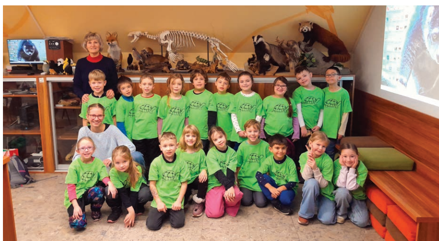
Předávání vysvědčení v ústecké ZOO.