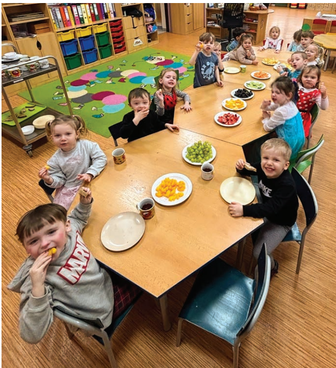
Narozeninová oslava u Berušek.

Velké poděkování patří všem dárcům – žákům, rodičům, zaměstnancům školy i obyvatelům obcí, kteří přispěli a podpořili dobrou věc. Zvláštní dík si zaslouží hlavně žáci třídy 5. A, kte-