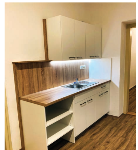
Rekonstrukce kuchyně v obecním bytě. Stav před rekonstrukcí a po instalaci nové linky.