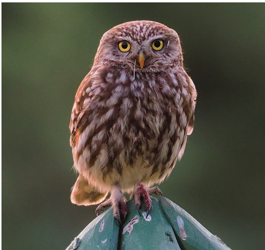
Sýček obecný.

Volně pohozené sítě, provázky či staré konstrukce mohou způsobit zamotání a úhyn nejen sýčků, ale i dalších ptáků. Stačí rozhlédnout se