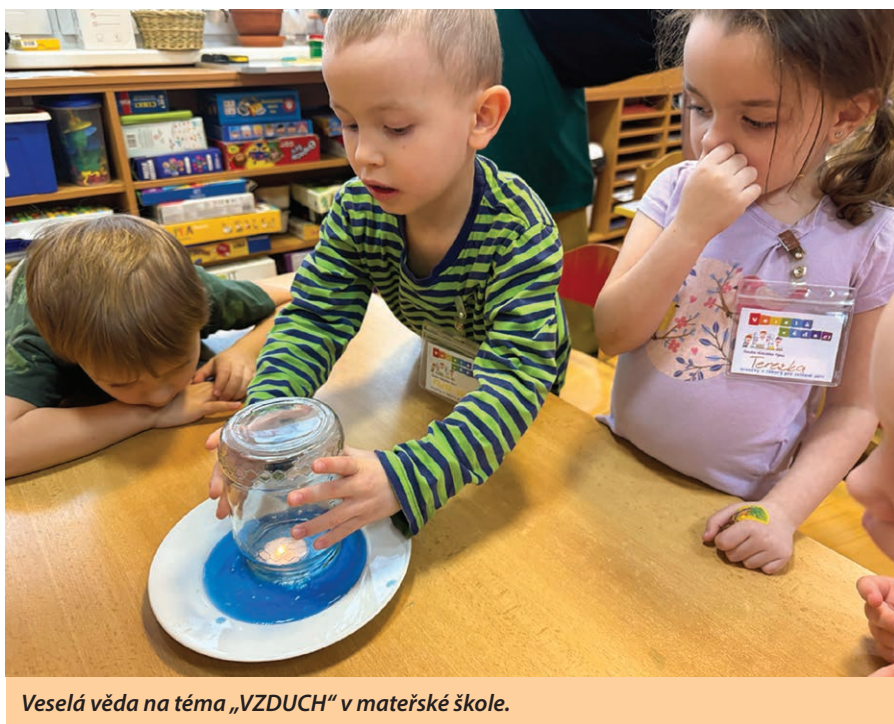
Veselá věda na téma „VZDUCH“ v mateřské škole.

Opět nám paní učitelky zpestřily naše školkové vzdělávání několika akcemi – přijela „VESELÁ VĚDA“ s tématem LIDSKÉ SMYSLY – čekalo nás zážitkové poznávání všech lidských smyslů, objevování úžasných schopností vlastního těla; do školky pozvání přijaly DENTÁLNÍ HYGIENIČKY s poutavou besedou plnou zajímavostí