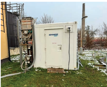
Kontejnerová technologie MINT-NANOREC – provoz na Čističce odpadních vod Velké Březno.

Group , která se již v roce 2021 stala Inovační firmou Ústeckého kraje.