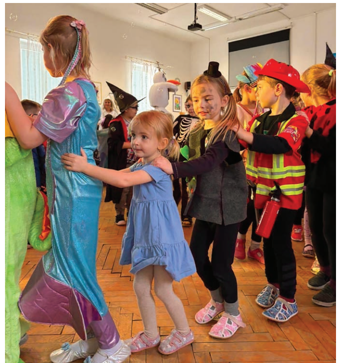
Karneval s prvňáčky.