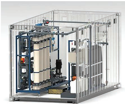
Kontejnerová technologie MINT-NANOREC – 3D-model technologie.

Velké Březno patří mezi první obce v České republice, které se na tuto změnu připravují už dnes. Na místní čistírně odpadních vod zde od loňského června probíhá demonstrační provoz inovativní technologie MINT-NANOREC , vyvinuté severočeskou společností New Water