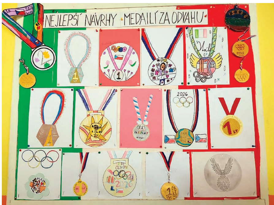
Originální návrhy medailí.