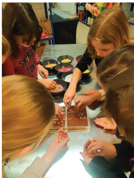
Pátáci si vysvědčení převzali v čokoládovně.