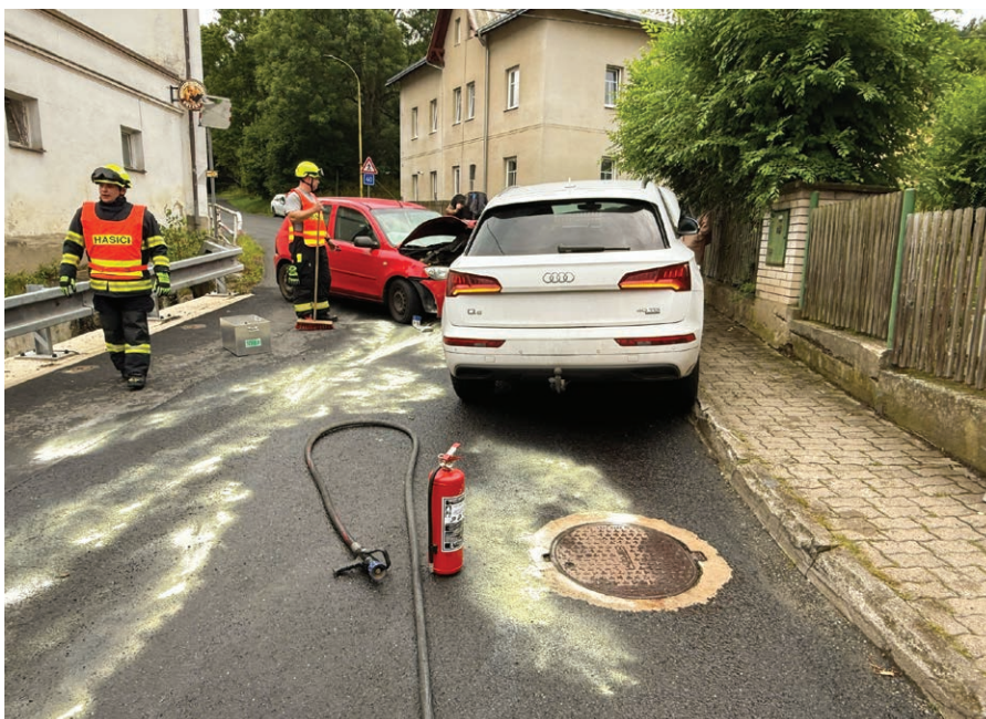
Zásah při dopravní nehodě ve Vítově.