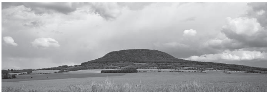
Hora Říp – důležitá část naší historie.

● Š. Voráč: Vyhlídka Větruše stojí na kopci u Ústí nad Labem, mezi řekou Bílinou a Labem. Podle pověsti stál na stejném místě hrad Větruš, ale to není pravda. Hrad byl v dnešním centru města. Zbytky zdí nalezené na tomto místě jsou bývalým popravištěm. Proto se kopec nazýval Soudný nebo Šibeniční vrch. Dnes tady je vyhlídková věž, která byla postavena v roce 1897. Postavil ji Ústecký horský spolek. V dnešní době je znova otevřena, a je tam restaurace, hotel a lanová dráha, se kterou můžeme jet do centra města a zpět. Na Větruši chodím často s mámou. A hlavně tam jezdíme lanovkou. To mě hrozně baví! Chodíme vždycky do bludiště, které je z keřů, a i do zrcadlového bludiště,