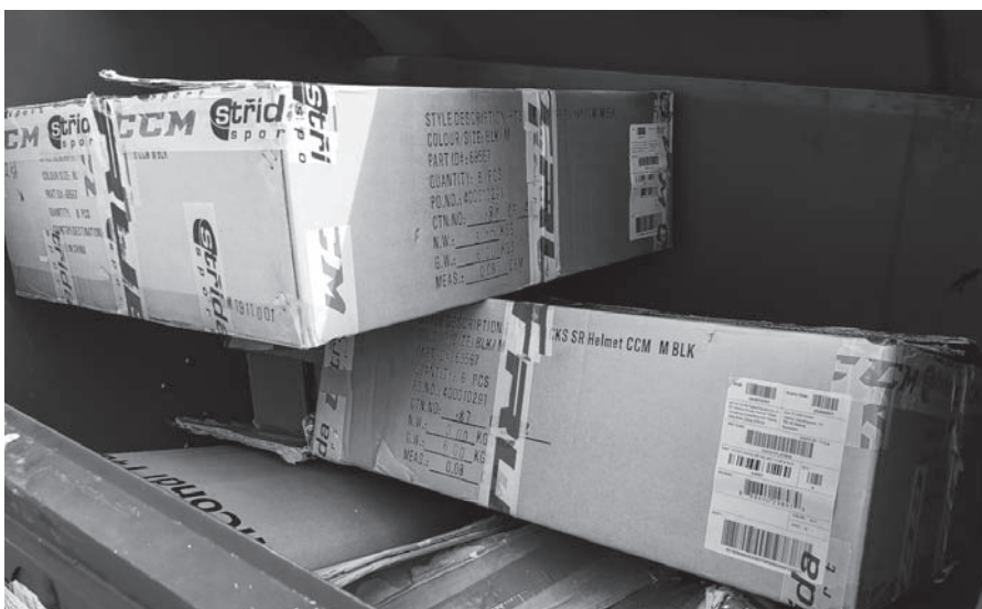
Nerozložené krabice v kontejneru mohou zabrat celou jeho kapacitu.

Kateřina Jelínková, Obecní úřad Velké Březno