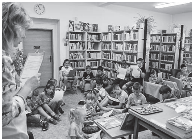
Snímky z projektu Už jsem čtenář – Knížka pro prvňáčka .