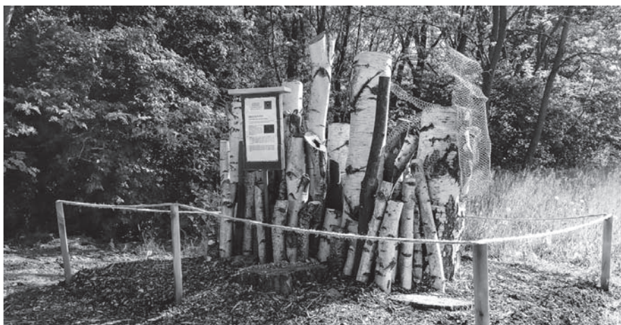
Nově vytvořené broukoviště v pískovně.

Netradiční broukoviště, které by se mělo stát domovem pro drobný hmyz, vzniklo ve valtířovské pískovně.