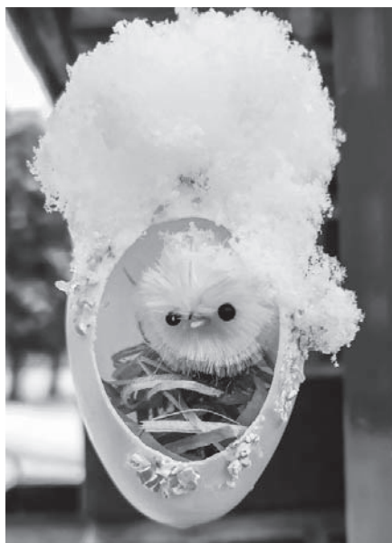
Letošní proměnlivé Velikonoce umožnily, že výzdoba školní branky prošla sněhovou proměnou.

Dne 1. 6. 2021 jsme ve školní družině oslavili Den dětí. Pro děti bylo připraveno šest disciplín, kde soupeřily se svými spolužáky. Všechny výkony byly oceněny a nikdo