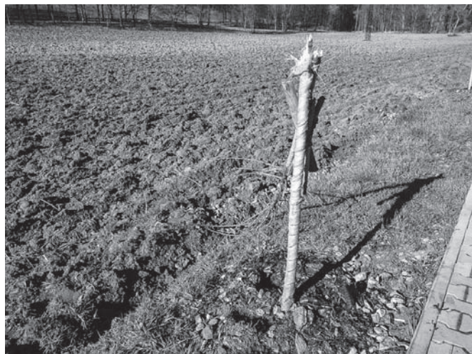
Nově vysazený strom poničený vandaly.

bývalého přístřešku na kontejnery. Toto místo bude přístupné pro každého, v každou denní dobu a umožní jednoduší dopravu balíků pro všechny, kteří tuto službu využívají. Nyní probíhá upřesnění podmínek smlouvy a následně bude stanovené datum zprovoznění.