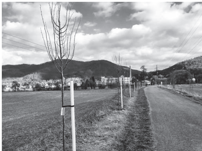
Výsadba lipového stromořadí u cyklostezky.