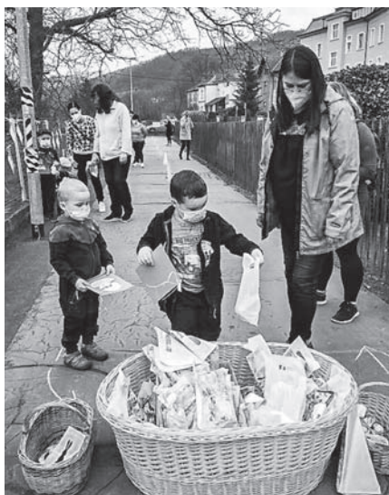
Velikonoce na plotě.

I přesto, že byla MŠ uzavřena, se paní učitelky rozhodly dětem přichystat „Velikonoce na plotě“, a také je alespoň na chvíli vidět a popovídat si s nimi! Za běžného chodu bychom si velikonoční období společně užívali, bohužel to situace nedovolovala. Ve čtvrtek 1. dubna na děti na školkovém plotě čekaly velikonoční úkoly – děti počítaly velikonoční vajíčka a určovaly jejich barvy, skákaly jako zajíčci, spojovaly stejné kraslice, zpívaly velikonoční koledy, hle-