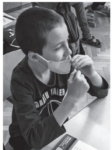
Děti ve Velkém Březně samostatně zvládly velmi dobře.

Náš velikonoční zajíček Velkáček měl za úkol ozdobit školní zahradu. S pomocí našich šikovných žáků a pedagogického