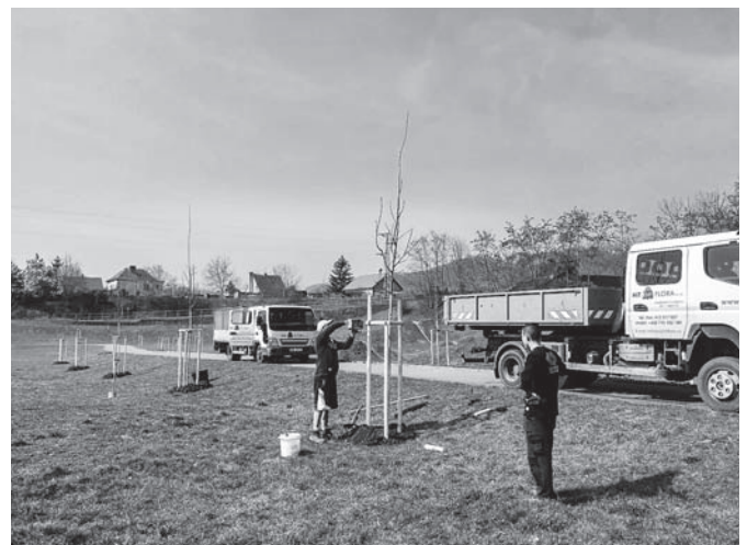
Výsadba stromků v pískovně.