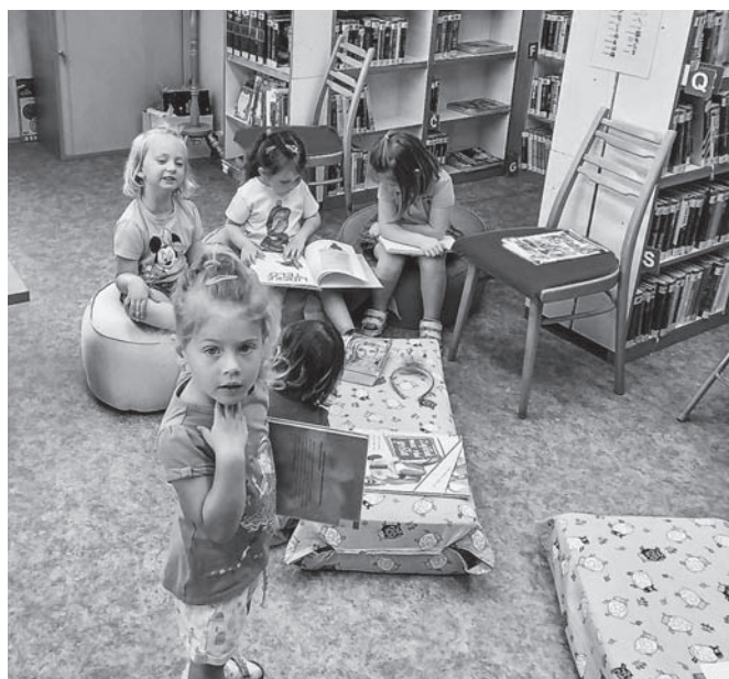
Třída Berušek navštívila místní knihovnu.