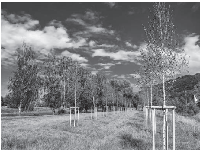
Nová alej u škvárového hřiště.

V minulých týdnech proběhlo jednání se zastupcem Zásilkovny o umístění výdejního automatu v naší obci. Rada obce na svém jednání rozhodla o umístění automatu na náměstí vedle