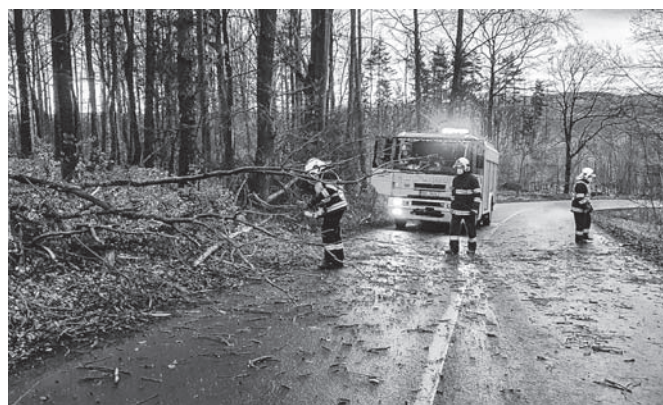
Dokumentární fotografie ze zásahů hasičů.