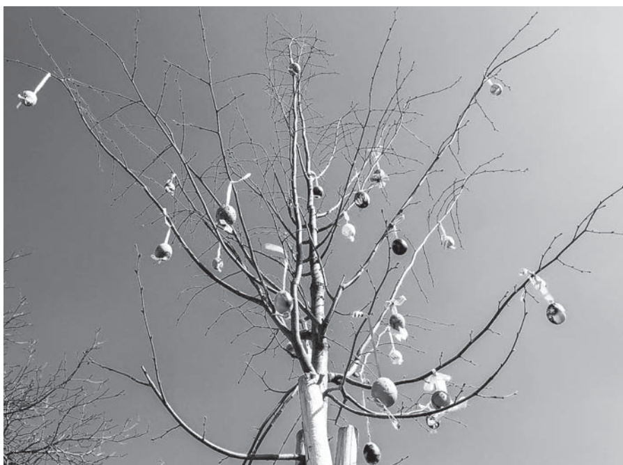
Kraslicovník na Velikonoce vyzdobily naše děti.

Například stavební materiál ke kontejnerům ani do sběrného dvora nepatří vůbec a každý si