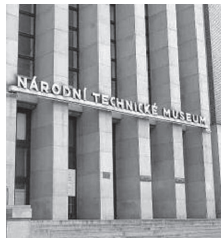
Národní technické muzeum

budov (budovy uranových dolů v Jáchymově, pavilon pro Lázně Velichovky, lázeňské budovy v Bohdanči, nemocnice v Prešově atd.). Postavil průmyslové budovy železáren v Podbrezové a soubor budov pro Masarykův hlubinný důl v Břešťanech u Mostu. V r. 1937 vyprojektoval se svým týmem během tří měsíců 28 budov pro vojenské letiště u Trenčína. Jeho nejznámějšími stavbami jsou budovy Národního technického muzea, Národního zemědělského muzea, palác ARA (Perla) v Praze a pro obyvatele Velkého Března též budova základní školy.