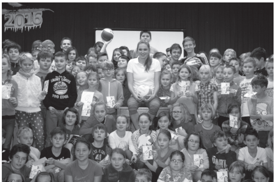
Sportovní dopoledne s autogramiádou.