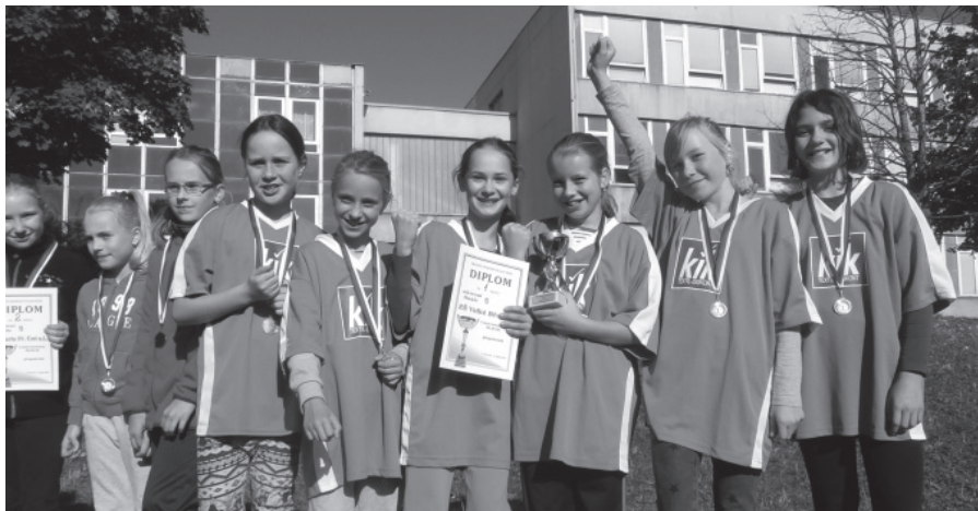
Vítězové zlatých pohárů.