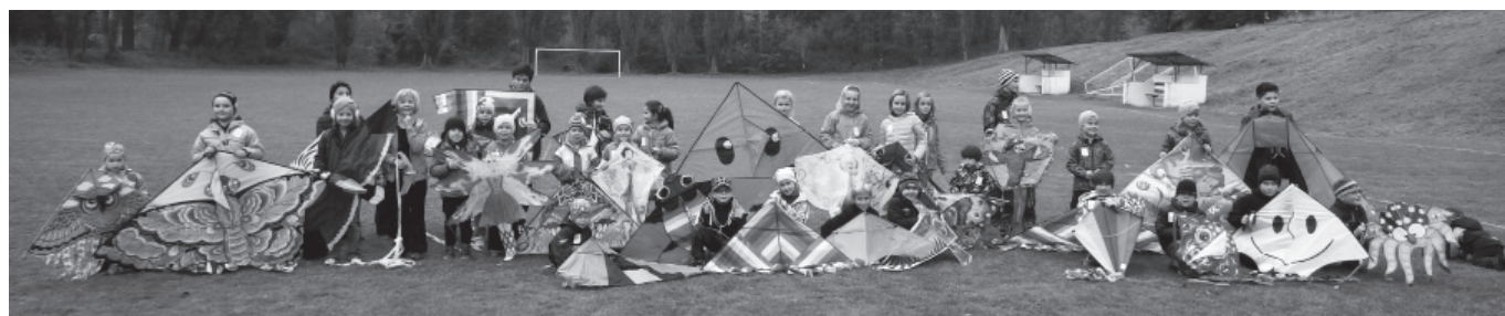
Drakiáda se vydařila. Tolik draků pohromadě není jen tak k vidění.