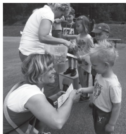
Nejmłodší účastník závodu.

Dne 23. 5. 2015 proběhl na Pískovně ve Valtířově 1. májový běh. Soutěžilo se hned v několika kategoriích. Dokonce se