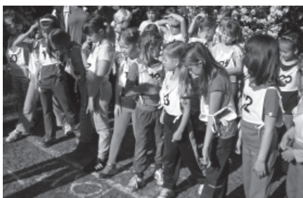
21. ročník běhu zámeckým parkem byl další významnou akcí, kterou pořádala velkobřezenská škola.

Mc Donald's cup, Všeználkova olympiáda, soutěž School Contest, Kouzelný park, žáci v rámci ZUŠ vystupují ve Velkém Březně i okolí, desítky výletů a exkurzí atd.