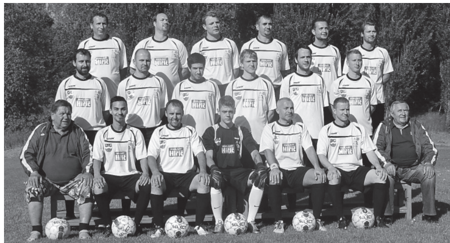
TJ Spartak Valtířov