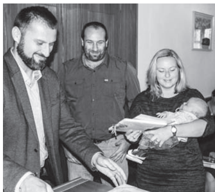
Slavnostní vítání občánků.