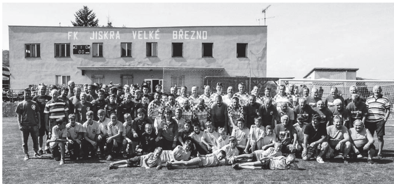
Veliká parta FK Jiskra Velké Březno.