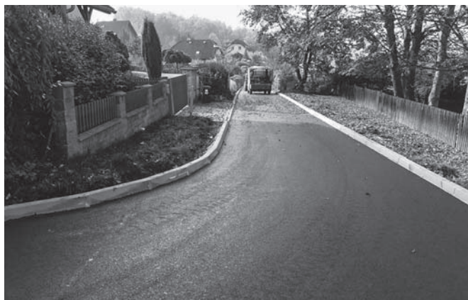
Místní komunikace Na Vyhliďce.

né době je před dokončením zadání pro jeho veřejné projednání. Toto zadání pro naši obec zpracovává ORP Ústí nad Labem a po veřejném projednání bude následovat výběrové řízení na zpracovatele územního plánu a pak již samotné práce na tvorbě ÚP.