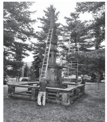
Rekonstrukce sloupu ve Valtířově.