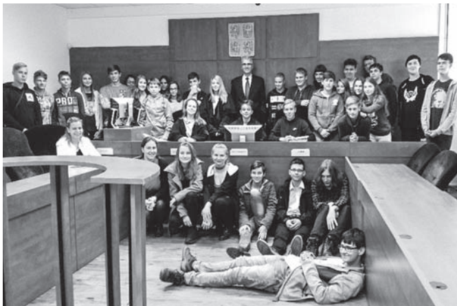
Společná fotografie s panem soudcem.

Video můžete zhlédnout na: https://youtu.be/_GLapOxyhM a sami posoudit kvalitu naší práce.