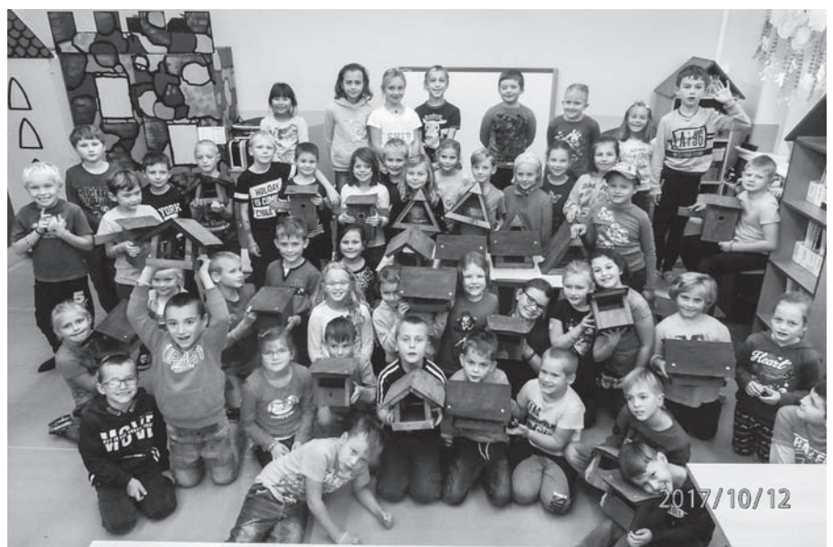
Společné foto školáků z projektu „72 hodin“.

Bylo 16. října 16.45 a školní jídelnou se lila neuvěřitelná vůně. To si 22 soutěžních rodin začalo nosit své pokrmy na své soutěžní místo. Pro soutěžící bylo připravené vegetariánské, veganské a bezlepkové jídlo od zaměstnanců školy a od paní kuchařek.