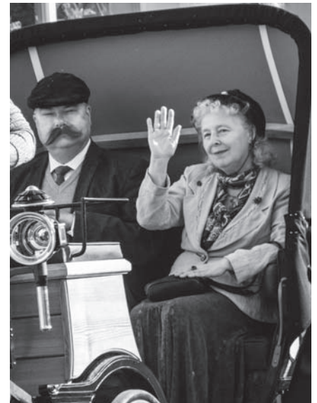
Snímek z „průvodu osobností“ k 850. výročí obce.

I letos projednávalo zastupitelstvo obce spoustu důležitých problémů a přijalo mnoho zásadních rozhodnutí, která mají dlouhodobý dopad na občany naší obce. Velmi důležitým rozhodnutím bylo schválení Strategického dokumentu obce pro roky 2017 – 2026. Tento rozvojový dokument byl vytvářen spolu s Vámi a jsou v něm definovány krátkodobé i dlouhodobé vize rozvoje naší