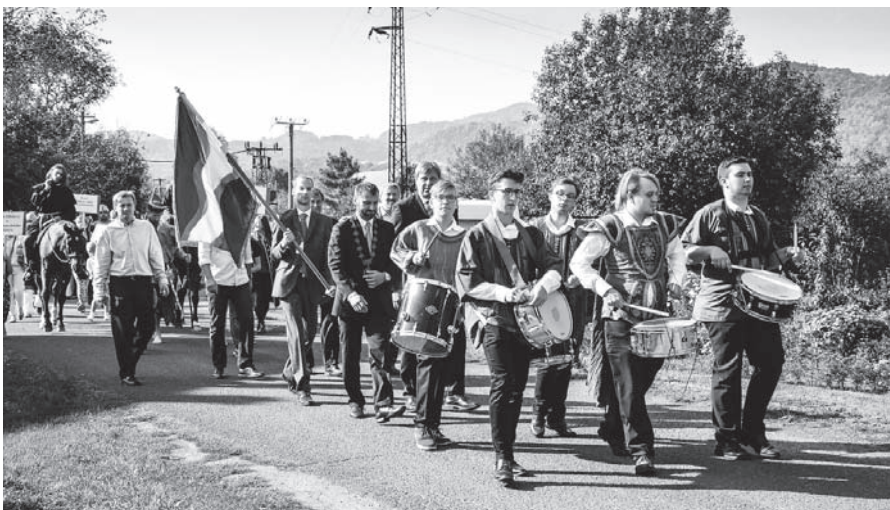
Slavnostní průvod s kapelou k 850. výročí obce.