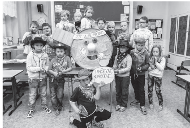
Pingpongová show ve Velkém Březně.