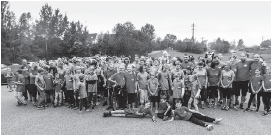
K 850. výročí obce se odehrálo také sportovní klání mezi zástupci katastrálních území.

V letošním roce probíhaly a stále probíhají práce na novém územním plánu. V součas-