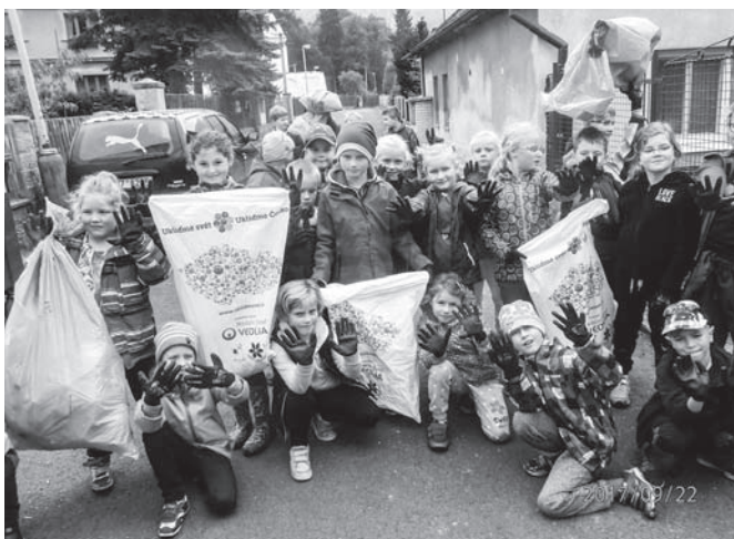
Žáci naší základní školy se zapojili do akce „Uklidme svět“.

Dobrý den, tak jsem ráda, že skončila další akce bez úrazu a pěkně se nám vydařila. Jako rodiče jste předvedli skvělou spolupráci. Ani nemohu jmenovitě poděkovat jednotlivcům, protože si nepamatuji, kdo z vás co přinesl, kdo z vás kolik přispěl do fondu. Prostě – děkuji! Jste správní! Ve třídě na děti čekaly předlohy a nápady pro práci. Díky