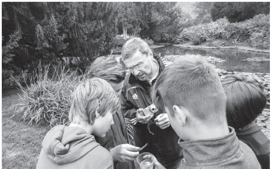
Badatelsky orientovaná výuka se odehrávala přímo v terénu.