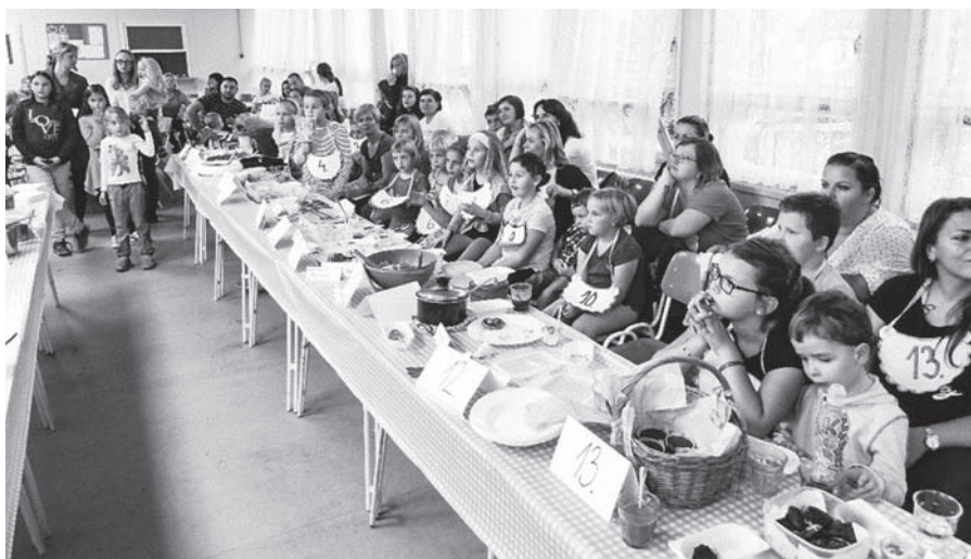
Světový den výživy ve školní jídelně.