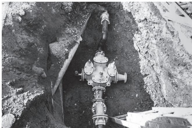
Rekonstrukce vodovodu – nové armatury.