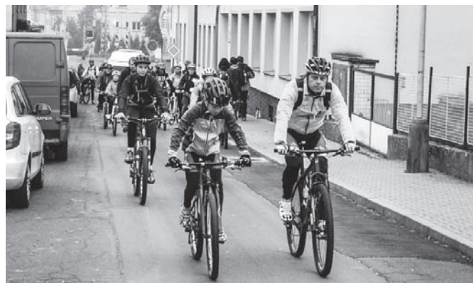
Dva snímky z „Expedice Buková hora“.