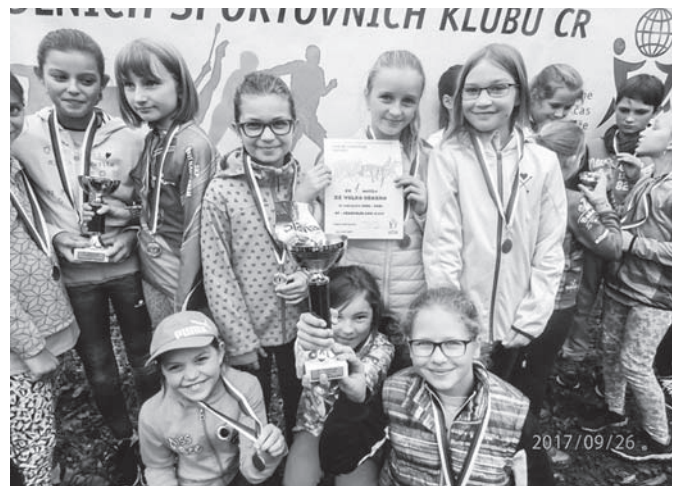
Naši vítězové přespolního běhu.