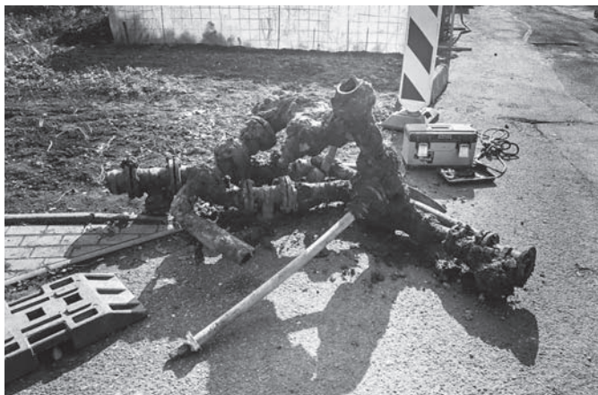
Rekonstrukce vodovodu – stav původního potrubí.

v Kolonii ve Valtířově a s realizací se počítá na jaře roku 2018. MMR budeme žádat o dotaci na rekonstrukci MK Zadní a Nová. V roce 2018 bude také vyhodnocena naše žádost o dotaci na vybudování tzv. Re – Use místa ve sběrném dvoře podaná na OPŽP, jejíž součástí by mělo být pořízení i menšího nákladního vozidla na svoz odpadu. MAS Labské skály budeme žádat o dotaci na vybudování nového chodníku pod zámekem. Ministerstvo zemědělství požádáme o dotaci na II. etapu