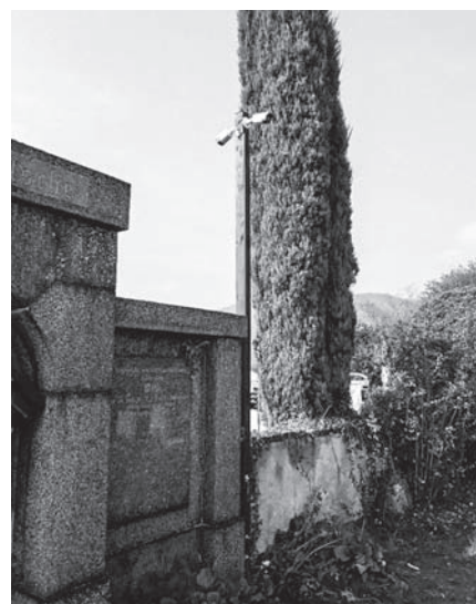
Kamery instalované na Hřbitově.

Rok 2018 bude pro naši obec v mnohém důležitý. Zahájena bude výstavba nové školní jídelny v areálu zahrady dolní budovy ZŠ. Budovat se bude také nový rozhlas, o který jste žádali v dotazníku ke strategickému dokumentu. Konkrétně půjde o 74 digitálních rozhlasových stanic, které budou umístěny na stožárech veřejného osvětlení. Dále se připravuje zpracování digitálního povodňového plánu. Dokončena bude projektová dokumentace na intenzifikaci čistírny odpadních vod Velké Březno a přeměnu ČOV Valtířov na čerpací stanici. Na tuto akci budeme v červnu podávat žádost o dotaci z OPŽP. Zpracovávat se bude také projektová dokumentace na zkapacitnění sítě vodovodních řádů, podle které by se měl v následujících letech budovat nový páteřní vodovod mezi vodním zdrojem ve Vítově a vodojemem ve Valtířově. Až na třetí pokus se podařilo získat nabídky na celkovou obnovu ČSOV