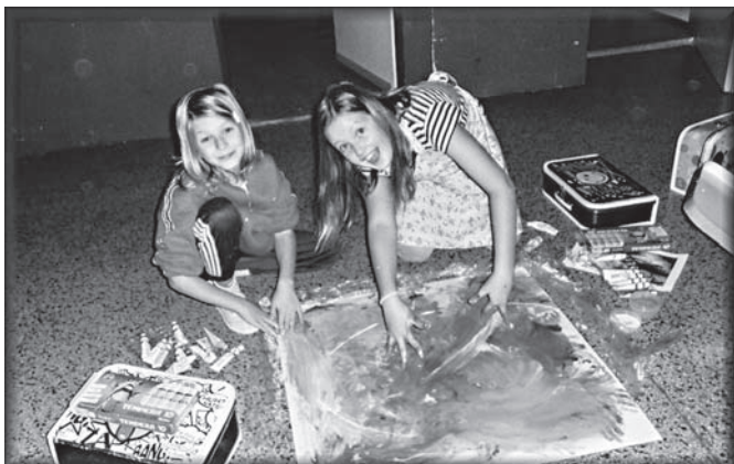
Originální způsob výuky dětí – „Cesta do pravěku“.