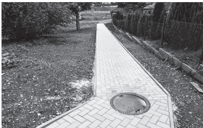
Chodník v ulici Krátká.