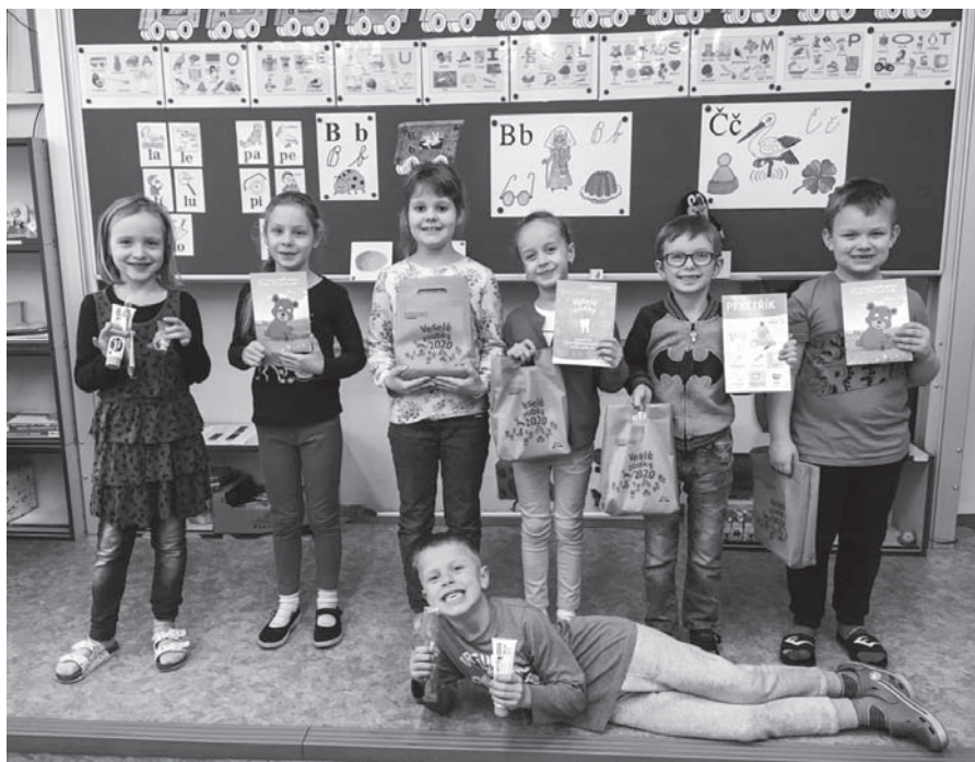
Preventivní program pro prvňáčky „Veselé zoubky“.

například: Jak často si mám měnit kartáček? Kolikrát ročně chodím k zubaři? Co je preventivní prohlídka? Následně nastala diskuze o pohádce a bylo zodpovězeno velké množství dětských otázek. Program byl zábavný i poučný. Úsměv na tváři dětem vykouzlila preventivní taštička. Jsem přesvědčena, že tato iniciativa přispěla ke zlepšení povědomí o správnou péči o dětský chrup.