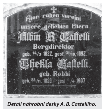
Detail náhrobni desky A. B. Castelliho.