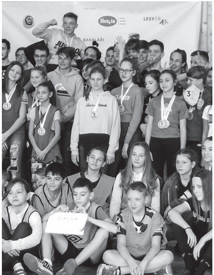
Společný snímek z pětiboje v rámci Odznaku všestrannosti.

Prevence úrazů a úrazy dětí – toto je stále se opakující téma mezi učiteli, vychovateli,