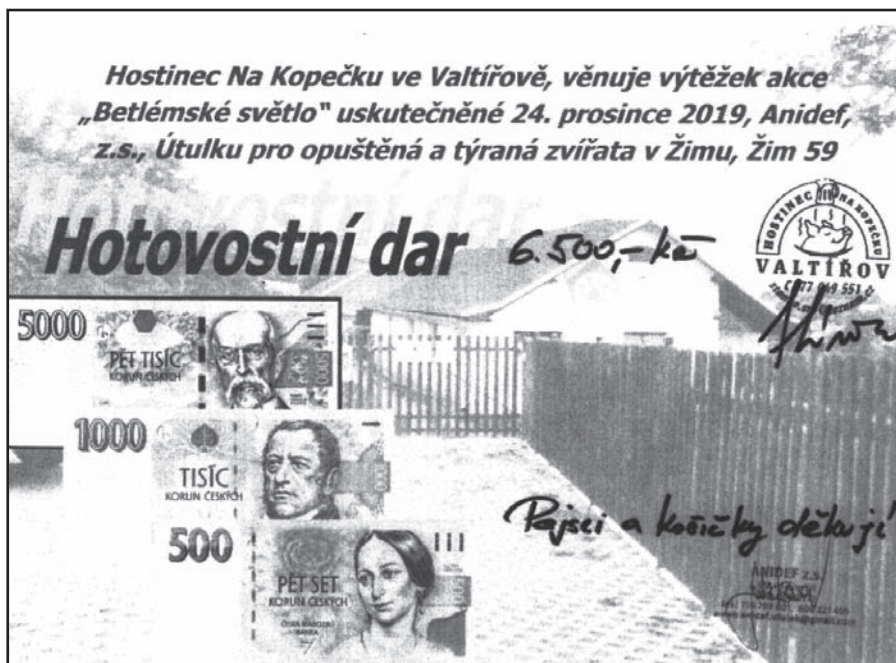
Děkujeme všem, kteří dorazili na vánoční setkání do Valtířova a finančně přispěli na psí útulek v Žimu. Zdeňka Stáňová

nutí a vodoprávního povolení, protože ta původní propadla, jelikož je někdo neodpovědný neprodloužil. Realizaci pro potřeby úspor nákladů lze provádět ve vlastní režii, protože obec má dostatek pracovníků.