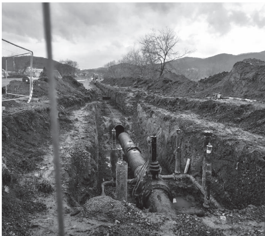
V polovině prosince začala plánovaná výměna vysokotlakého plynovodu, který vede ve spodní části Velkého Března. Část potrubí leží přímo pod cyklostezkou u přívozu, a tak zemní práce na několik týdnů omezí i uživatele cyklostezky. Bohužel bude muset být pokáceno i několik bříz, které cyklostezku lemují. Stromy totiž byly zhruba před padesáti lety vysazeny přímo v ochranném pásmu plynovodu. Výměna plynovodu není v gesci obce. (red)