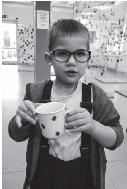
Snímek z výletu do porcelánky v Dubí.

V lednu nás ve školce překvapili Tři králové, pěkně se nám představili, společně jsme si pak zazpívali; vysvětlili nám, co znamená Tříkrálová sbírka, rádi jsme do kasičky také přispěli. Opět k nám zavítalo Divadlo Koloběžka, tentokrát s „Pruhovanou pohádkou“ a sférické kino se zimním příběhem „Polaris“. Paní učitelky pro nás připravily výlet do Porcelánky v nedalekém Dubí. V příjemném prostředí dubského infocentra jsme si nadekorovali svůj vlastní hrneček, používali jsme zvláštní druh obtisků, na výběr byly rozličné motivy. Hrnečky musely projít ještě jedním výpalem, proto nebylo možné je odvézt ihned s sebou domů. Za čtrnáct dní nám byly doručeny do školky a my se mohli pochlubit rodičům. V tomto měsíci měl proběhnout ještě společný karneval s prvňáčky a Divadlo Krabice si pro nás chystalo pohádku „Václavka a slimák“, bohužel bylo hodně