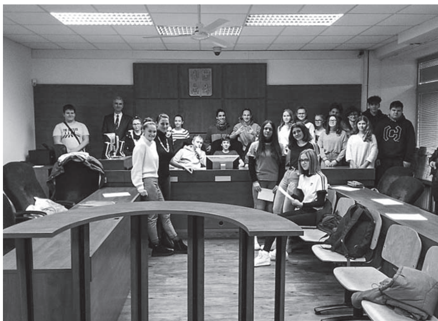
Exkurze do Krajského soudu v Ústí nad Labem.

rodiči a dětmi. Za velmi důležitou proto považujeme prevenci úrazů a poskytování první pomoci.