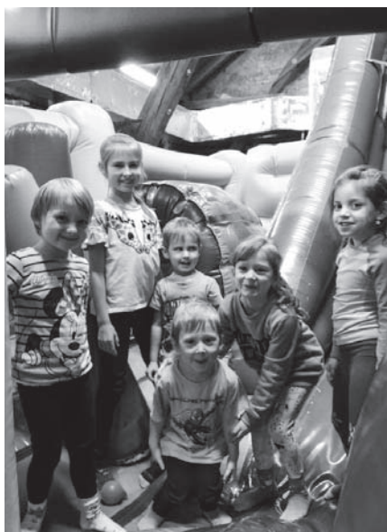
Snímky z návštěvy dětí z mateřské školy v děčinském Hopsáriu.