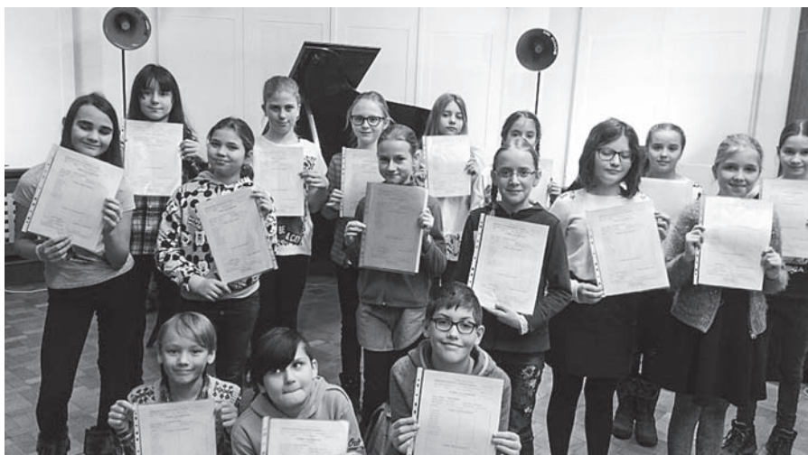
Tajné předávání pololetního vysvědčení proběhlo v ústeckém Českém rozhlasu.