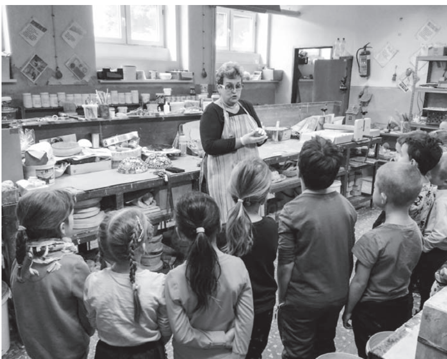
Z návštěvy předškoláčků v keramické dílně na základní škole.