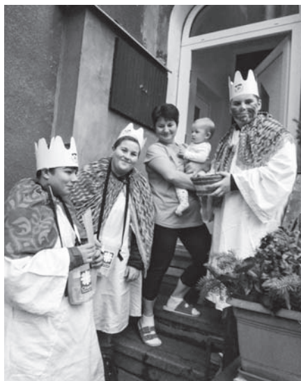
Koledníci pro Tříkrálovou sbírku.

Třída 1. A a 1. B se dne 4. 3. zúčastnila preventivního programu „Veselé zoubky“. Pomocí pohádky se žáci dozvěděli informace, které předtím o zoubkách ještě nevěděli