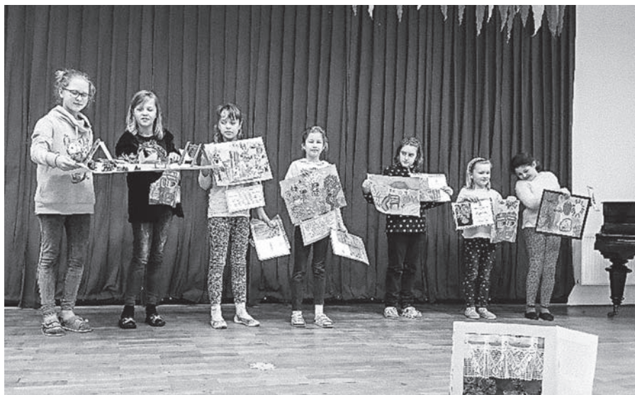
Postupující týmu do republikového kola (1. stupeň).