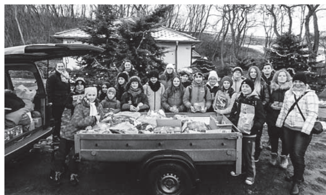
Školní okénko VI.