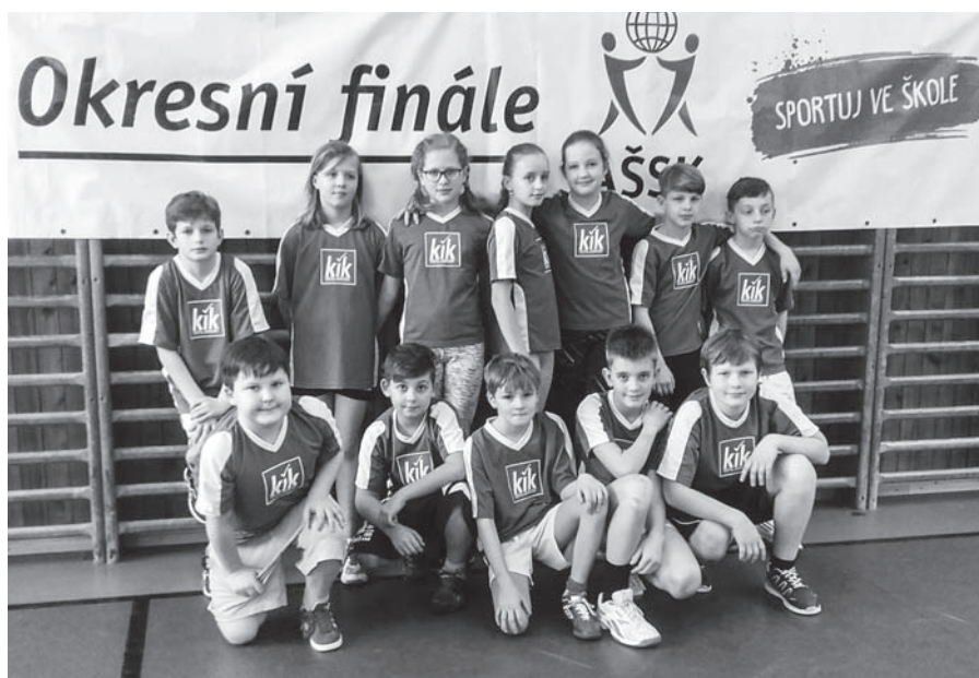
Tým, který se na turnaji v přehazované umístil na 4. místě.