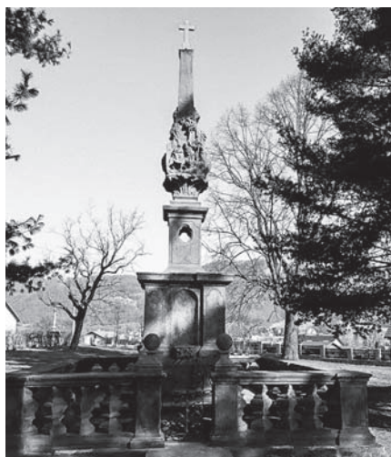
Sloup Čtrnácti svatých pomocníků.

Od října loňského roku probíhala rekonstrukce valtířovského sloupu, která spočívala v odborném očištění celé památky, zhotovení nových kamenných koulí s podstavci u vstupní branky, vymodelování a osazení replik 28 chybějících kuželek balustrády, zhotovení kamenného vrcholového kříže a výrobě a osa-