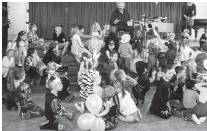
Školní okénko IV.