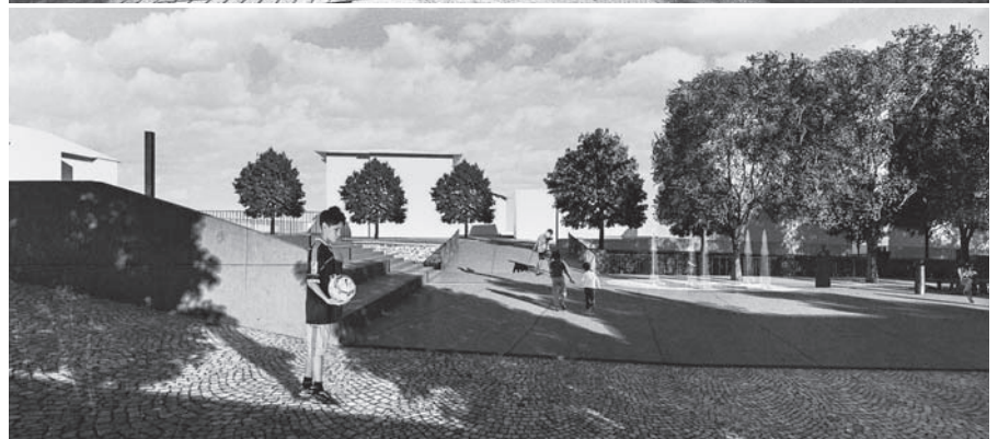
Vizualizace architektonické studie.