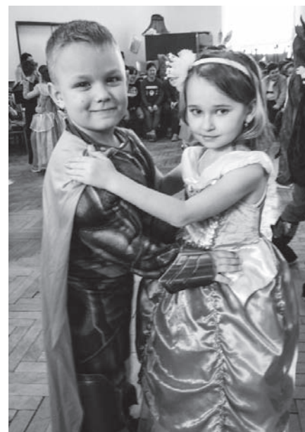
Z karnevalu v mateřské škole.