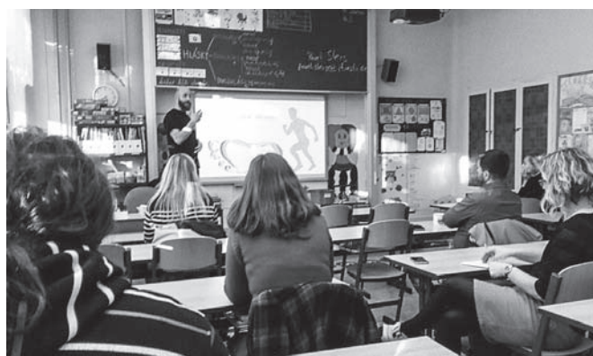
Školní okénko II.