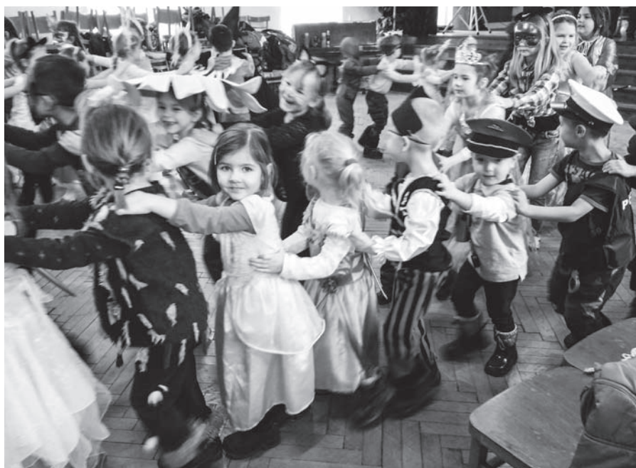
Radost dětí je nefalšovaná...

V závěru bych ráda zmínila naše další aktivity: