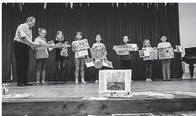
Školní okénko I.