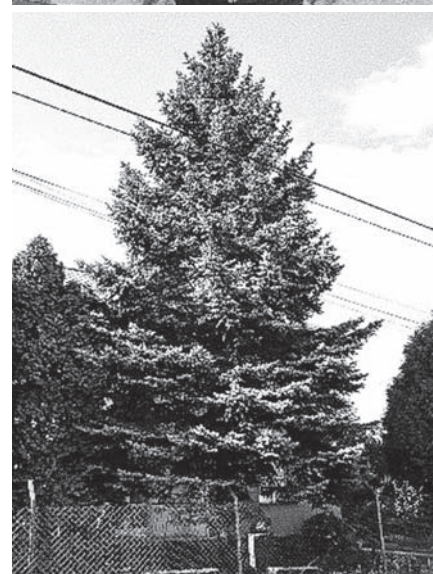
Na počátku je roztomilá malá sazenička. To se ale po letech může změnit.