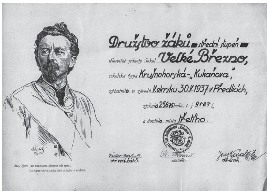
Diplom velkobřezenských Sokolů z roku 1937 ze sportovních závodů v Předlicích.

z něj zase opravdový zámek – byl postupně opraven a zpřístupněn veřejnosti a v dnešní době se pyšní bohatou sbírkou nábytku, obrazů, porcelánu, knih, hodin a samozřejmě i fotografií.