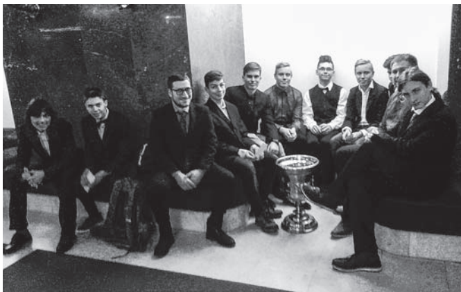
Školní okénko III.