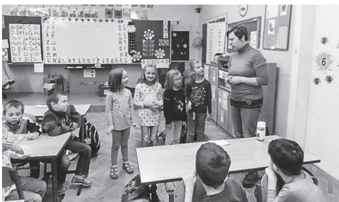
Školní okénko V.