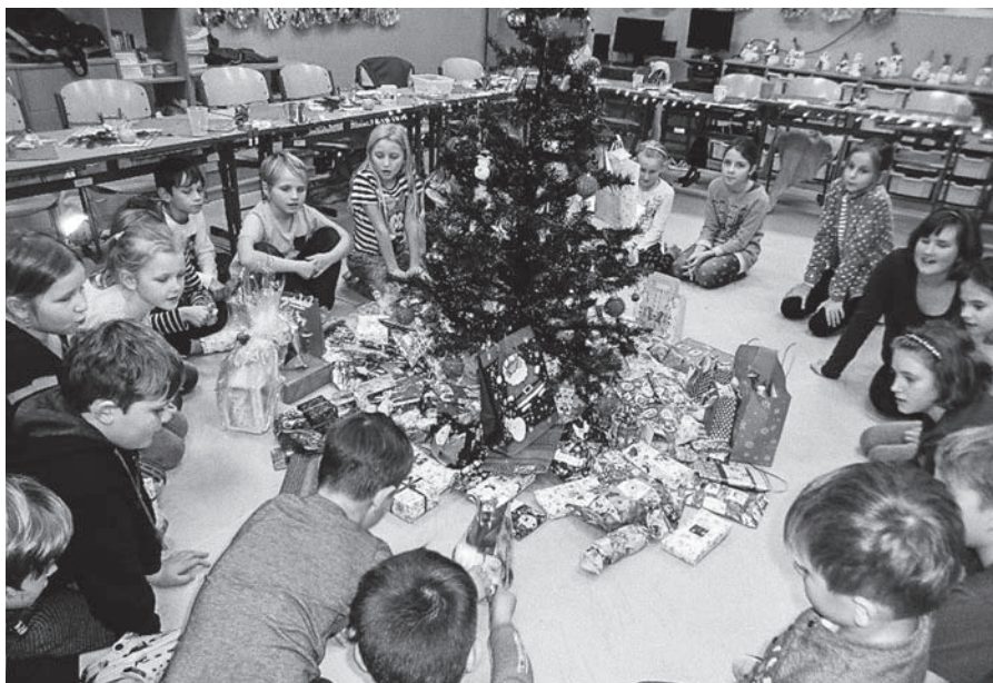
Nocování ve škole.