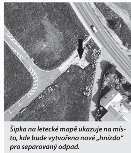
Šipka na letecké mapě ukazuje na místo, kde bude vytvořeno nové „hnízdo“ pro separovaný odpad.

Libuše Kršková, referent Životního prostředí