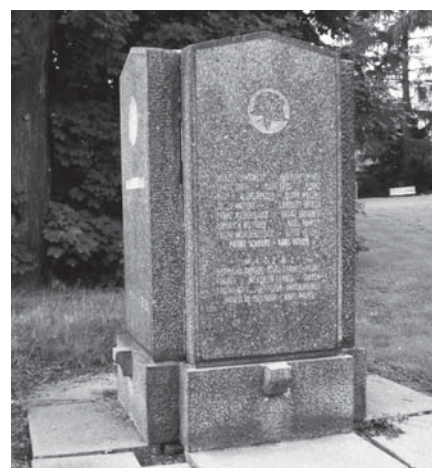
Pomník ve Velkém Březně

né vlastivědné literatuře či turistických průvodcích není o něm jediná zmínka. Z umístění pomníku se dá odvozovat, že za jeho vznikem stojí rodina Chotků. Do leštěné jihočeské žuly jsou vyryta jména obětí světové války (84 jmen), jména obětí z tehdy samostatné vesničky Vítova jsou uvedena zvlášť. Mezi naprostou převahou jmen německých se objevuje i několik typických českých jmen. Vysvěcení a odhalení pomníku vykonal ředitel litoměřického Institutu hluchoněmých, bývalý polní kaplan Johann Otto. Podle návrhu architekta Ernsta Bergera pomník vytvořila firma Berger a Vogt.