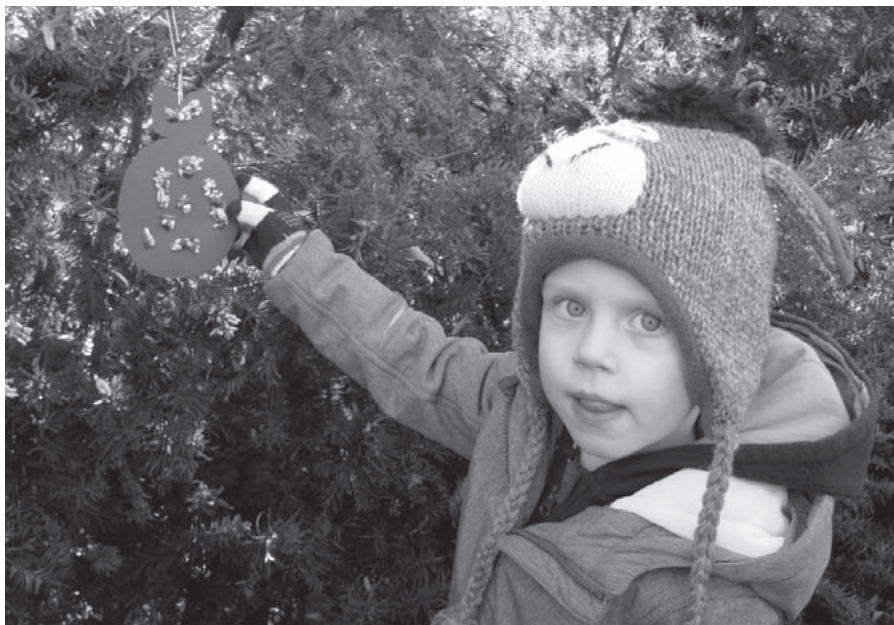
Zdobení stromů s dobrotami pro ptáčky v ústecké zoo

Mensa je mezinárodní společenská organizace založená roku 1946 v Oxfordu. Je to sdružení nadprůměrně inteligentních lidí. Členem se může stát každý, kdo dosáhne