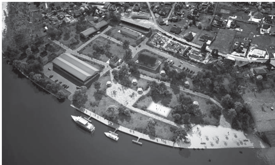
Vizualizace nové podoby Loděnice Valtířov

Poté, co bude vydáno stavební povolení a bude vyřízena dotace, by nejdéle do 2 let měla proběhnout výstavba hlavních účelo-