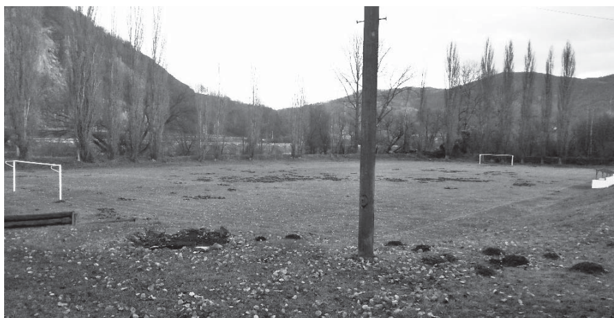
Plocha hřiště po řádění divokých prasat

Spartak se také velkou měrou podílí na kulturním dění ve Valtířově. Jako každý rok jsme pořádali tři akce. První akcí bývá