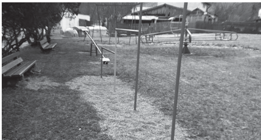
Proběhla údržba a opravy na dětských hřištích včetně dopadových ploch

Je však také třeba zmínit, že v rámci platné právní úpravy jsou stanoveny výjimečné důvody, pro které občan může odepřít podání vysvětlení, případně i svědeckou výpověď. Tyto závažné důvody je však vždy nutné správnímu orgánu sdělit a prokázat.