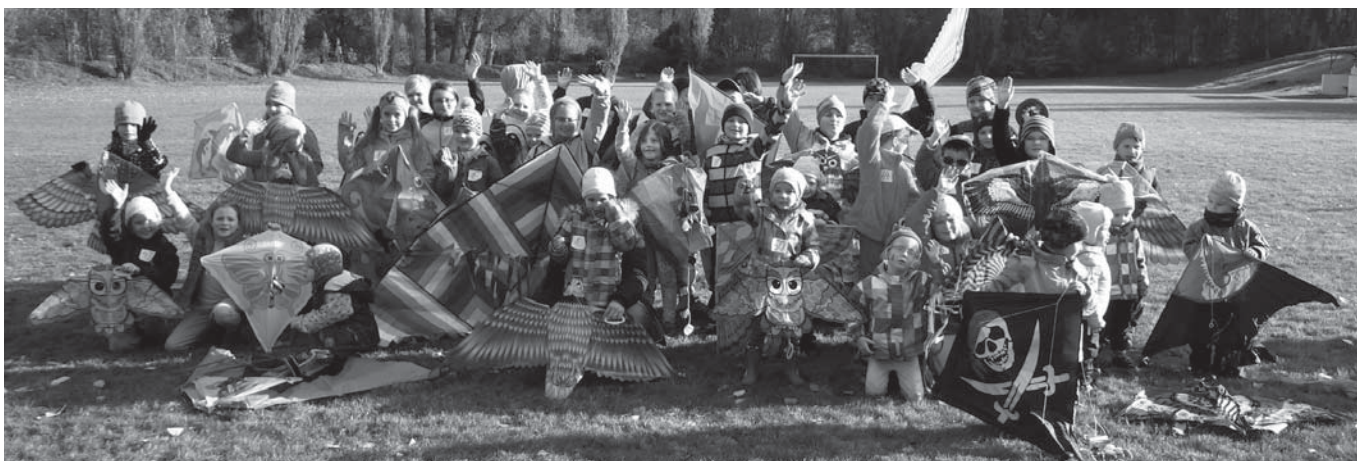
Při drakiádě se na nebi objevilo na padesát draků!

Sezóna 2016–2017 pro nás nezačala vůbec dobře. Po skončení podzimní části náleží našemu mužstvu s pouhými čtyřmi