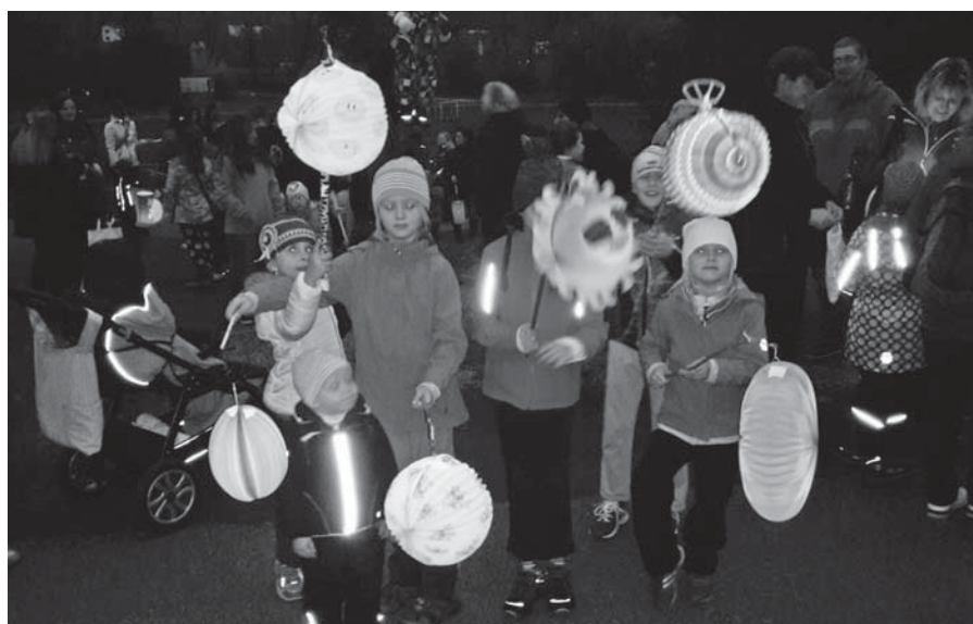
Snímek z Lampionového průvodu

4. 12. 2016 si přišlo zařadit několik desítek dětí v maskách čertů a andílků na tradiční Mikulášskou zábavu.