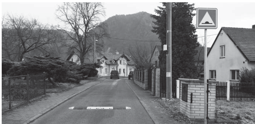
Zpomalovací práh ve Valtířově instalovaný pro zvýšení bezpečnosti