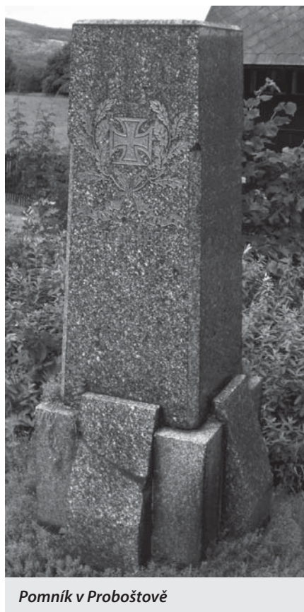
Pomník v Proboštově

V zahradě velkobřezenského zámku je umístěn pomník obětem 1. světové války. Slavnostně byl odhalen 5. září 1926. V běž-