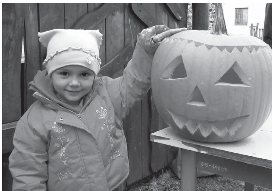
Snímek z tradiční akce „dýňování“ a opékání buřtíků

Dýňování a opékání buřtíků – tradiční odpolední akce, při které děti a rodiče dokázali společnými silami vykouzlit z obyčejných dýní nádherná díla, ta nám pak nějakou dobu zdobila školní zahradu. Příjemné bylo i neformální popovídání u ohně, ope-