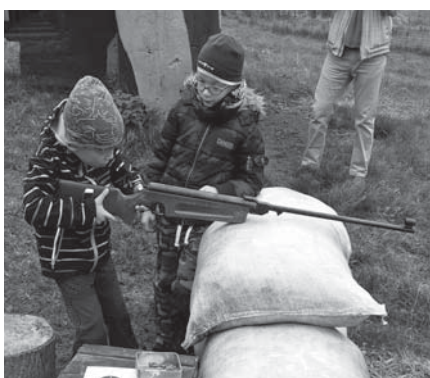
Sportovně-naučné akce před řopíkem byly atraktivní i pro děti

výhrami a bohužel s osmi prohrami 9. místo tabulky. Což je pro nás velkým zklamáním.