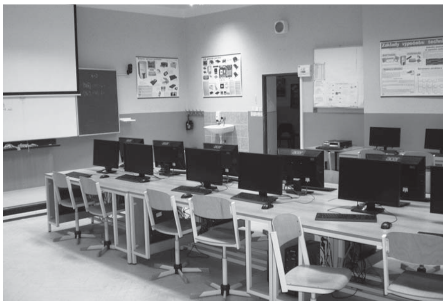
Odbornou počítačovou učebnu si škola pořídila z projektu EU Peníze školám

Akce, na které se sešlo 120 občanů Valtířova a Velkého Března, aby oslavili konec léta a užili si poslední slunné odpoledne letošního roku. Byla to příležitost pochlubit se svými výpěstky, svým chovatelským umem a kulinářskou dovedností. Všichni návštěvníci měli možnost prohlédnout si zvláštní plemeno francouzských kohoutů a překrásné králiky z chovu místních občanů. Neuvěřitelně obrovské papriky, vyrostlé na valtířovské půdě, 16 druhů jablek z pouhých 3 stromů. Přičemž na jednom kmeni je naroubováno až 7 druhů jablek a společně si rostou a nepřekáží si! Ochutnali jsme sladké, kyselé, slané a všelijaké jiné dobroty ze zásob našich sousedů. A navíc, všichni, kteří se nějakým způsobem podíleli na akci (sponzoři, soutěžící, ti co přinesli na ochutnání, porotci, ...) si pochutnali na grilované krkovicí a kýtě.