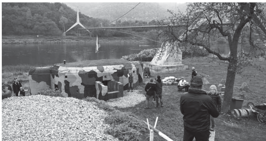
Snímek z akce „zamykání bunkru“

Na závěr si neodpustím malé zamyšlení... Díky nezměrnému úsilí a energii, kterou