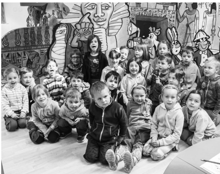
Výlet do Muzea Čtyřlístku v Doksech.

V pátek 21. 4. jsme se sešli na školní zahradě, abychom společně oslavili Den Země. Zahájení proběhlo vyvěšením vlajky a zaspíváním naší oblíbené písně „Třídíme odpad“, která se stala hymnou této události. Děti se postupně vystřídaly na 12ti stanovištích, kde byly připraveny různorodé úkoly