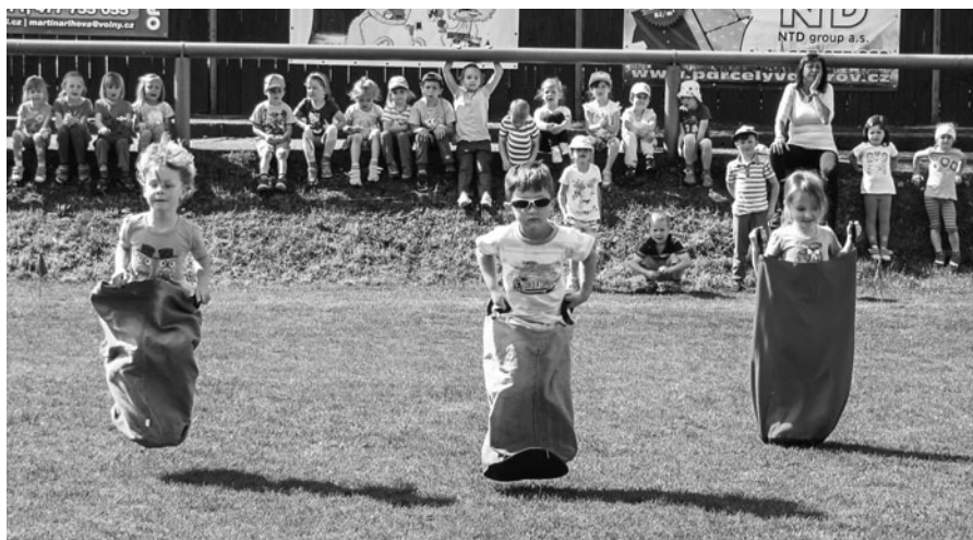
Olympijské hry pro děti v prostoru fotbalového hřiště.

Krásné jarní dny jsou jak stvořeny k vycházkám a výletům, proto jsme se vydali do blízkého Muzea lidové architektury v Zubrnících. Místní průvodci nás velmi poutavě provedli celým skanzenem a odolávali dětským všetečným otázkám a připomínkám. Dětem se líbilo i posezení ve staré škole s rukama za zády, ale některým to dlouho nevydrželo, a tak si vyzkoušely i nějaký ten trestík za nekázeň a nepozornost - klečení na hrachu, předpažení s ukazovátkem, oslovskou lavici, apod.