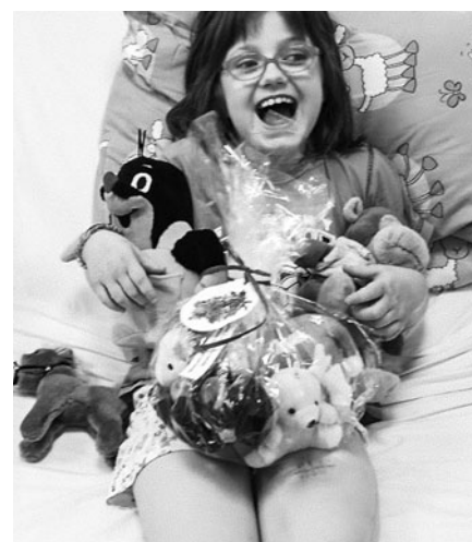
Nefalšovaná radost malé pacientky z darovaných hraček.