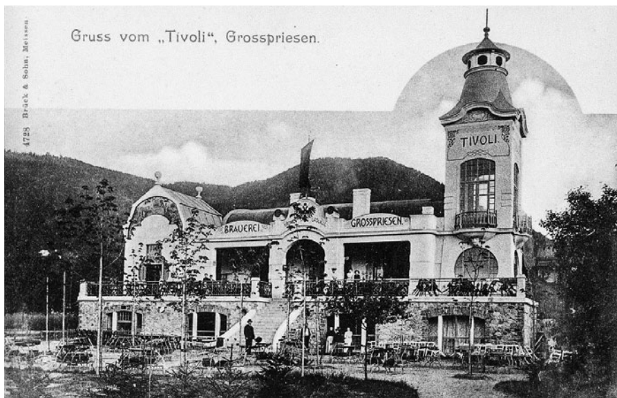
Zde je nad střední bránou vidět znak orlice.