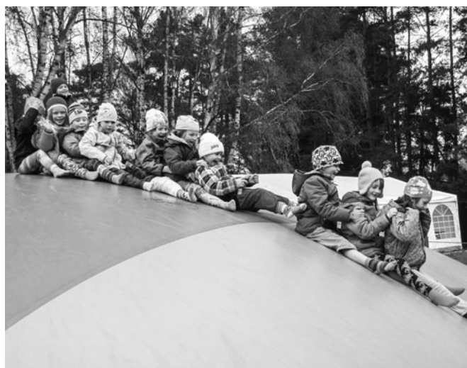
Skákací hrad neztrácí na atraktivitě.