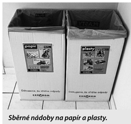
Sběrné nádoby na papír a plasty.

Pro snadnější třídění odpadů se Obecní úřad Velké Březno rozhodl pro umístění dvou papírových krabic, do každého domu s pečovatelskou službou, které budou sloužit jako přechodné stanoviště pro sběr papíru a plastu.