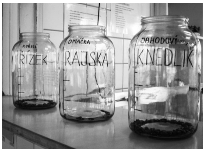
Do nádob s názvem jídla žáci vhazovali hlasovací fazole. Vyhrály jahodové knedlíky.