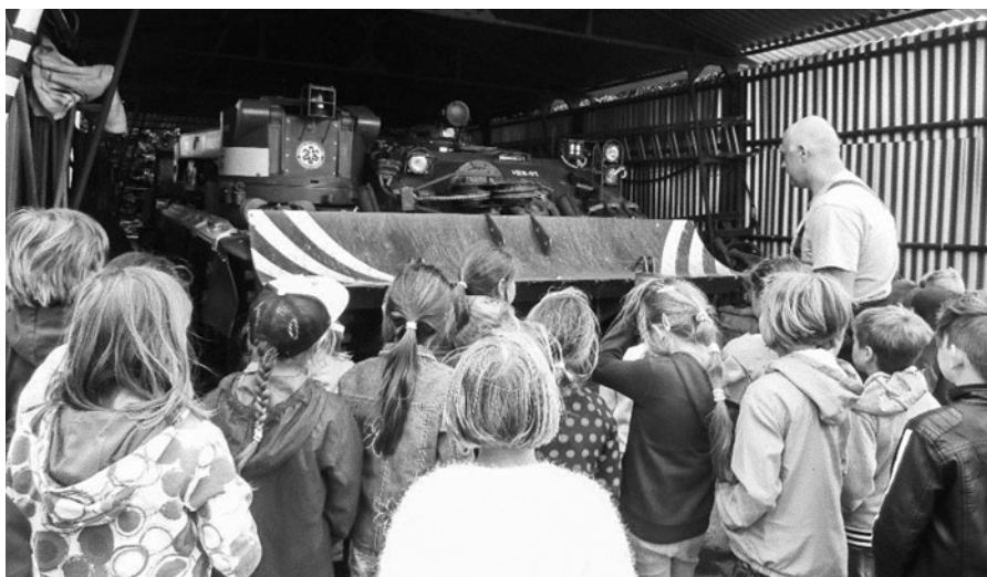
Snímek z exkurze k pražským hasičům.