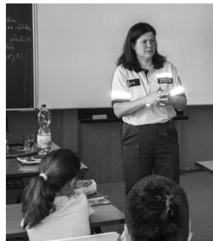
Odborníci z Policie ČR dětem názorně vysvětlili nebezpečí, která na ně číhají na sociálních sítích.

Sociální sítě se tak stávají i prostorem pro existenci sociálně-patologických jevů. Uživatel-manipulátor předstírá jiný věk a vzhled a využije důvěřivosti dětí, kteří pak svolí k osobní schůzce. Na pravdivost informací v sociálních sítích nelze spoléhat. Výzkumy dokazují, že 42,5% dětí je ochotno jít na osobní schůzku s člověkem, kterého znají jen z internetu. Podle statistik je vystaveno tzv. kyberšikaně 25 - 35 % dětí.