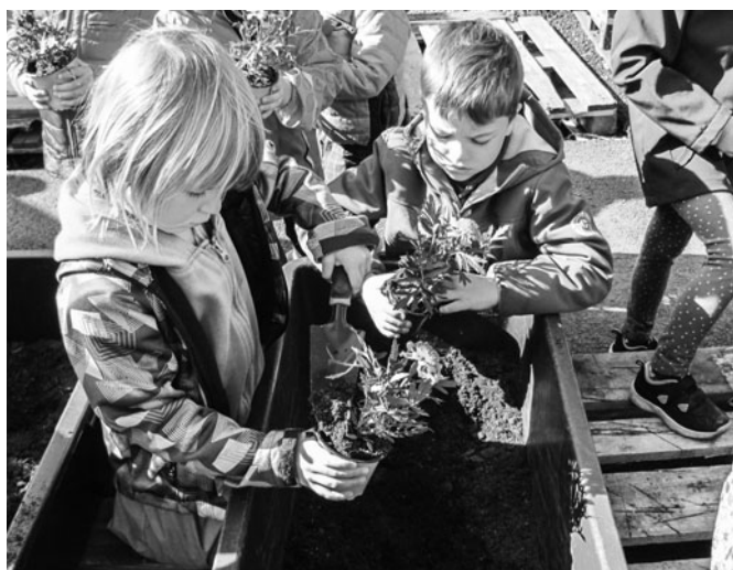
Tvořivá dílnička v Zahradnictví Kolev.

V posledních týdnech jsme se pilně chystali a nacvičovali na třídní besídky, chtěli