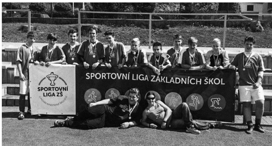
Vítězný tým hráčů minikopané.