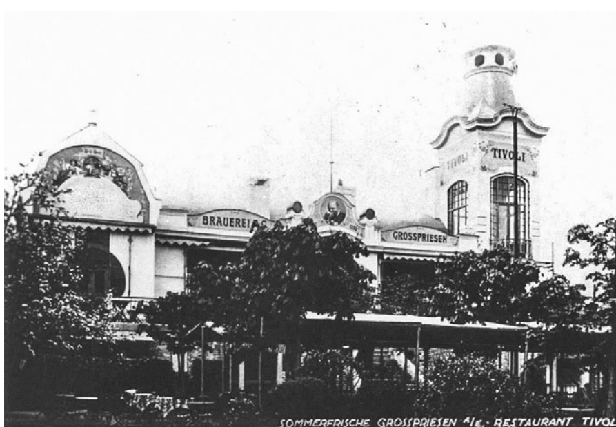
Na tomto snímku je již vidět znak Cipich.

Úspěchy velkobřezenského pivovaru byly korunovány oceněním dvorské kanceláře rakouského císaře, od níž pivovar získal „pro výtečnou kvalitu“ právo používat státního symbolu rakouského orla na podni-