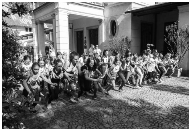
Start Běhu zámeckým parkem.