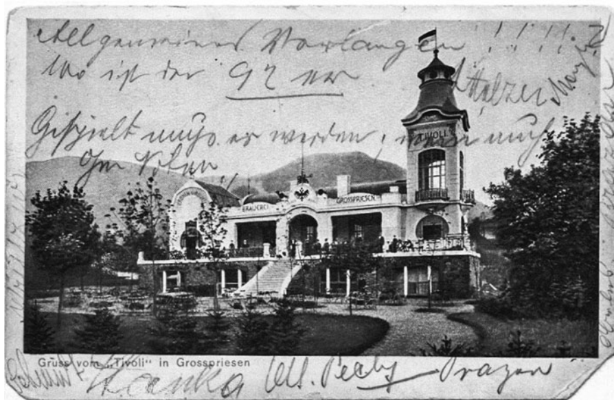
Tivoli bylo původně pavilonem na výstavě.