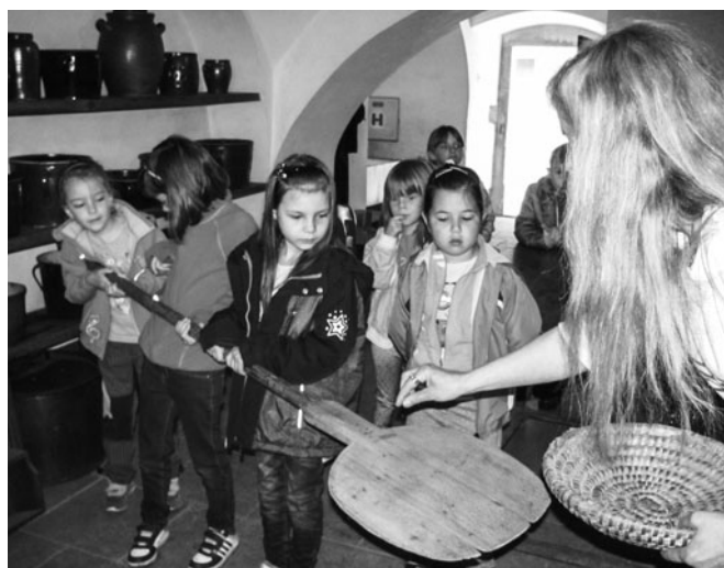
Snímek z návštěvy Muzea lidové architektury v Zubrnících.