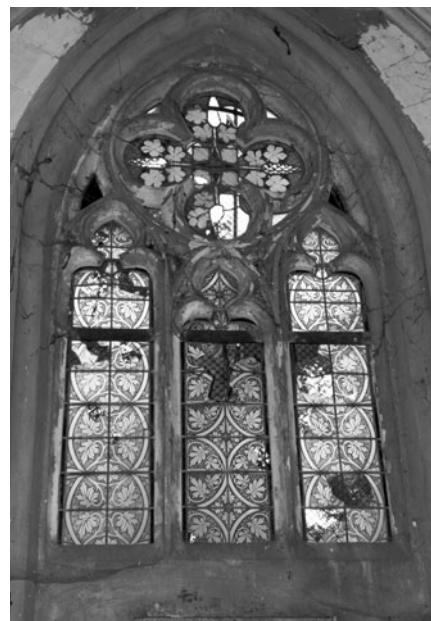
Vitrážové okno před rekonstrukcí.