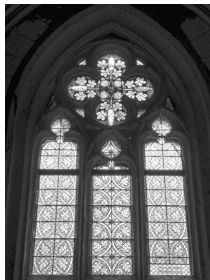
Vitrážové okno po rekonstrukci.