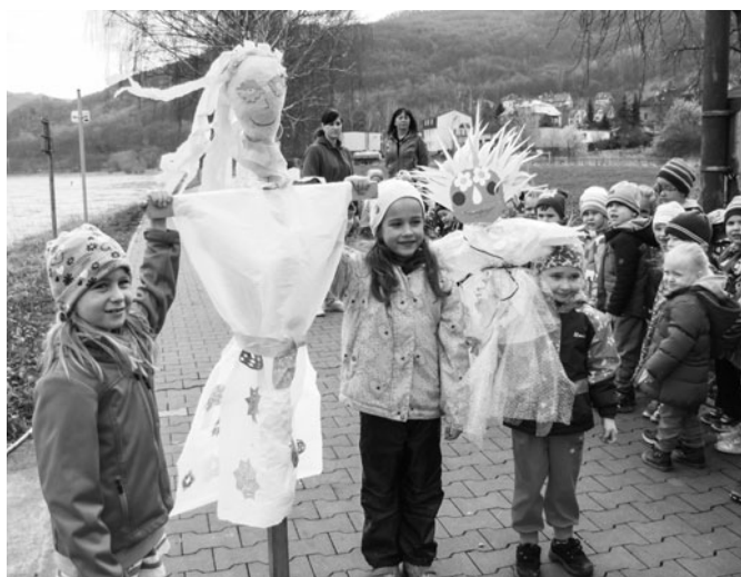
Dětské výtvary z čarodějnického reje.