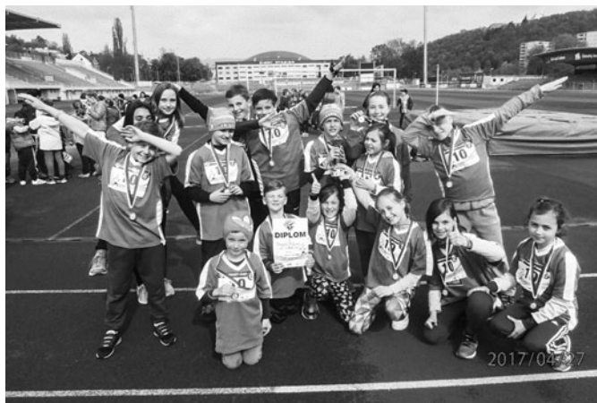
Stříbrní medailisté ze štafetového poháru.