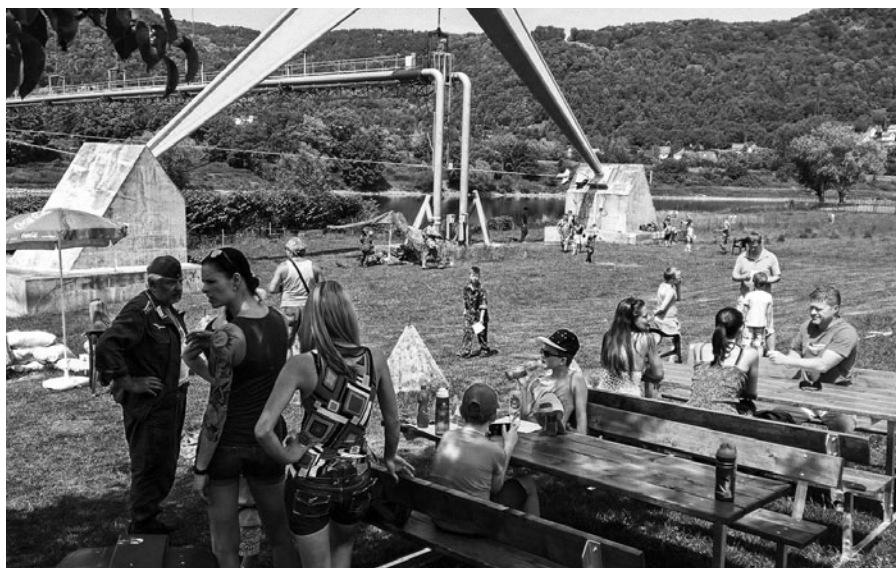
Snímky z dětského dne u řopíku.