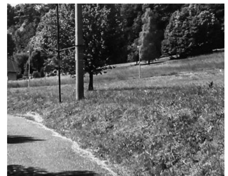
Srovnávací snímky prostoru před a po vyžínání trávy.