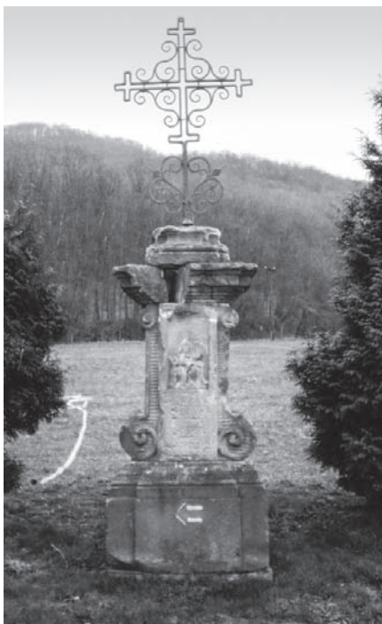
Několik let stará fotografie podstavce sochy svatého Petra z roku 1739.