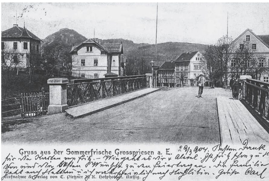
Most přes Homolský potok na fotografii z počátku 20. století.