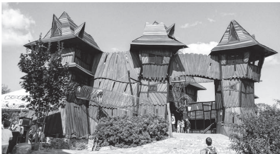
Prolézací hrad dětského světa v Mirákulu u Milovic.