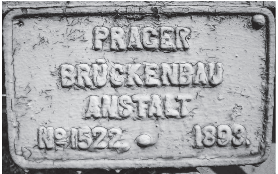
Kovová cedulka na mostě přes Homolský potok se dochovala z roku 1893.

Na fotografii (na následující straně) staré několik let je zachyceno torzo sochy sv. Petra (vlastně pouze podstavec). Socha sv. Petra původně stála na Vartě a později byla přemístěna na Velichov. Na dolní fotografii vidíte současný stav. Socha byla restaurová-