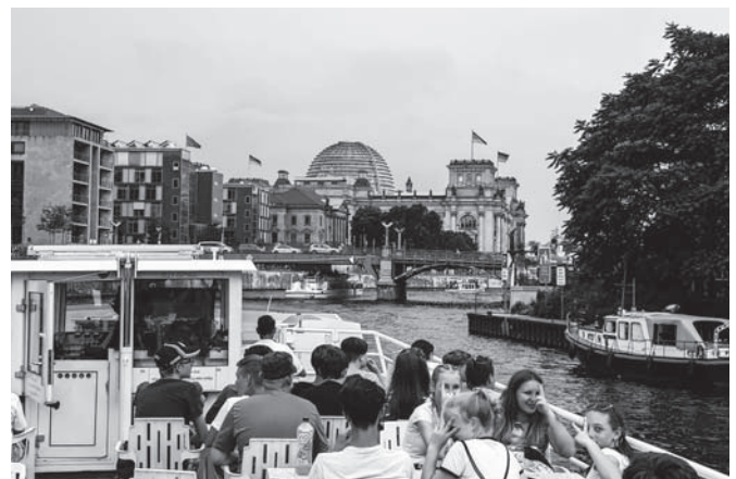
Snímek z výletu žáků naší školy do Berlína.