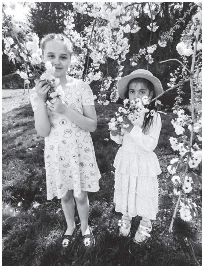
Jedna z fotografií charitativního kalendáře, který vznikl ve spolupráci naší základní školy a Dětského domova Střekov.