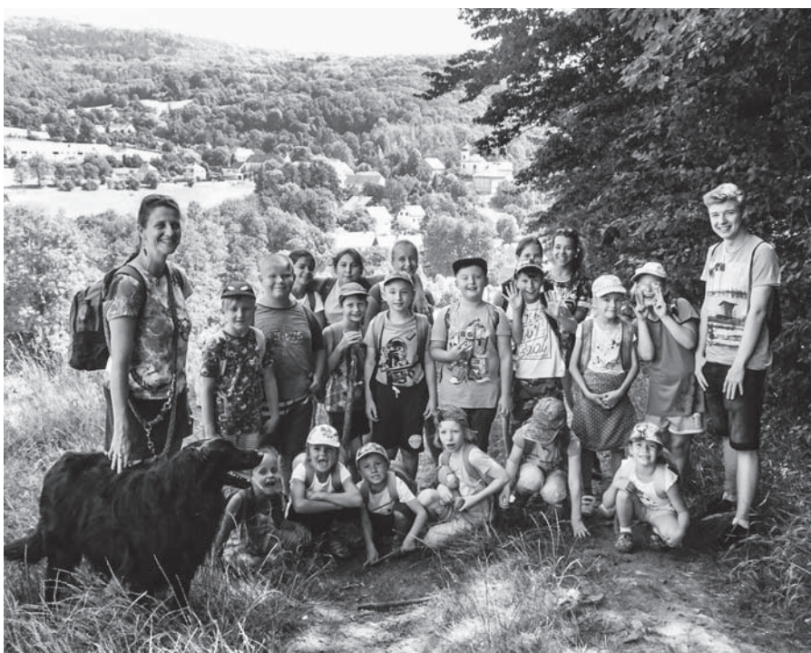
Indiáni z Března na příměstském táboře.

indiánské čelenky, trička s motivy orla, želvy, ještěrky, slunce, lapače snů, peříček ad., všechny kmeny dohromady vytvořily jeden totem složený z jejich posvátných zvířat, upekly si a hlavně snědly kukuřičné placky s agávovým či kukuřičným sirupem nebo marmeládou. Samozřejmě nesměla chybět ani návštěva indiánské vesničky Rosehill v Růžové u Děčína a nedaleké mýdlárny, kde se děti dozvěděly, jak se ručně vyrábí mýdlo nebo šampony. Jako praví indiáni prozkoumali všichni účastníci také blízké okolí svého tábora a při průzkumech navštívili Víťovu rozhlednu v Náchkovicích a naučnou stezku v Zubrnících.