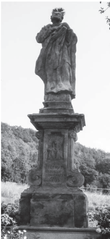
Současný stav sochy svatého Petra.