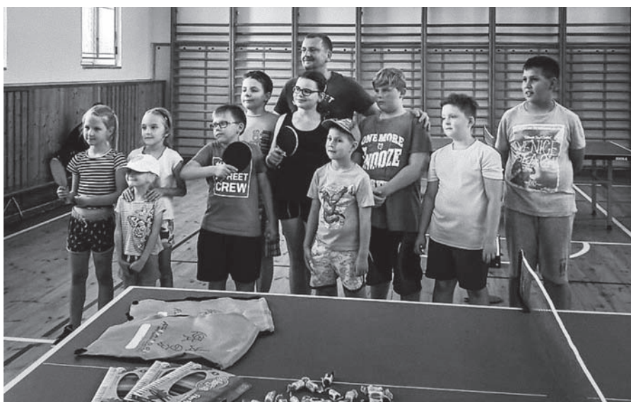
Závěrečný turnaj ve stolním tenisu.