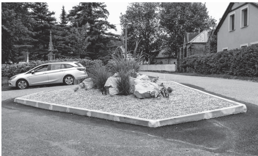
Ostrůvek u Chotkovy hrobky ve Valtířově.

Přeji vám všem hezký a barevný podzim Zuzana Mendlová