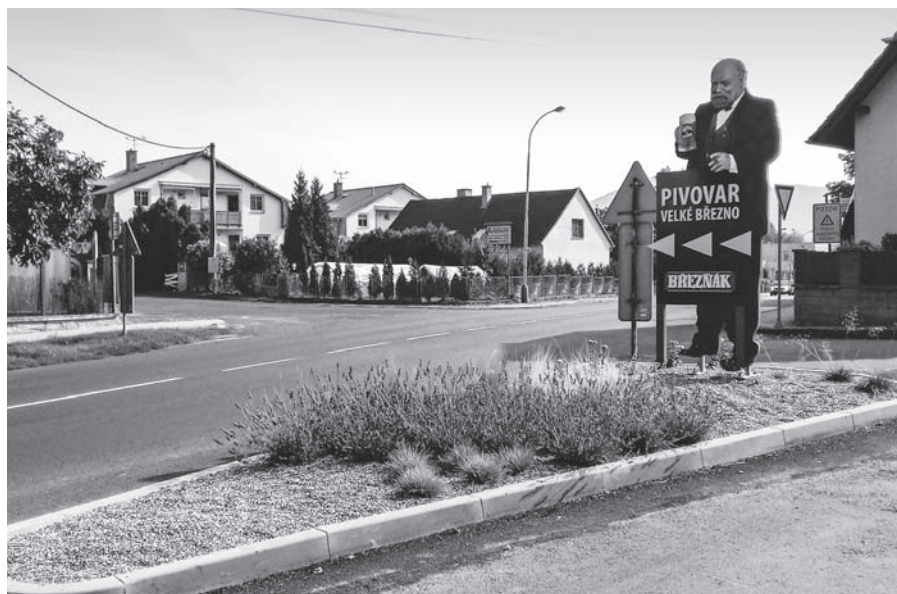
Ostrůvek s legendárním Cibichem ve Velkém Březně.

Nebezpečný odpad dejte ke svým odpadovým nádobám v dostatečném časovém předstihu.