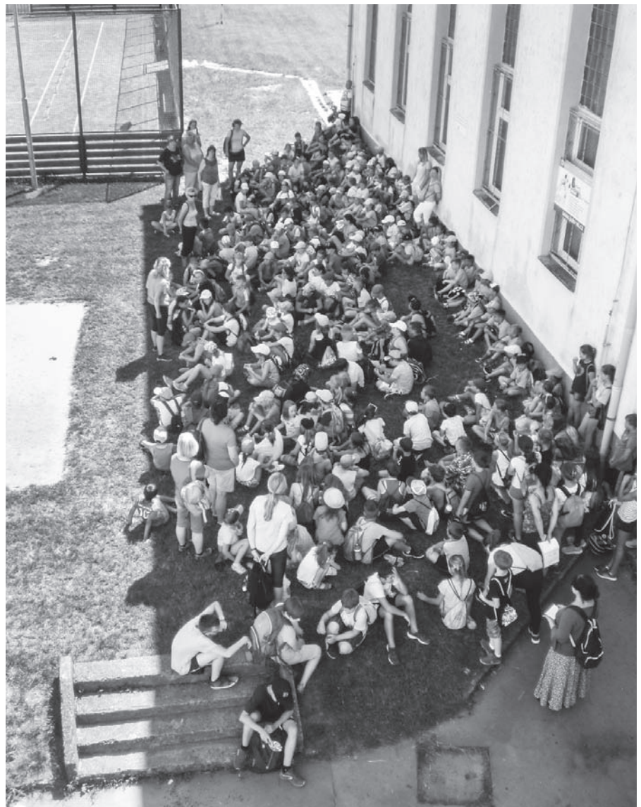
Během turistického dne se žáci prvního stupně před palčivým sluncem ukryli do stínu.