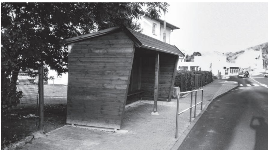
Nová autobusová zastávka ve Velkém Březně.

Přestože výsadbě rostlin letošní horké a suché počasí moc nepříalo, podařilo se i tak upravit některá místa v obci. Nové ozdobné trávy, levandule a další nenáročné druhy květin ozdobily dříve zanedbaná a často také hůře přístupná místa u autobusových zastávek v centru Velkého Března i ve Valtířově.