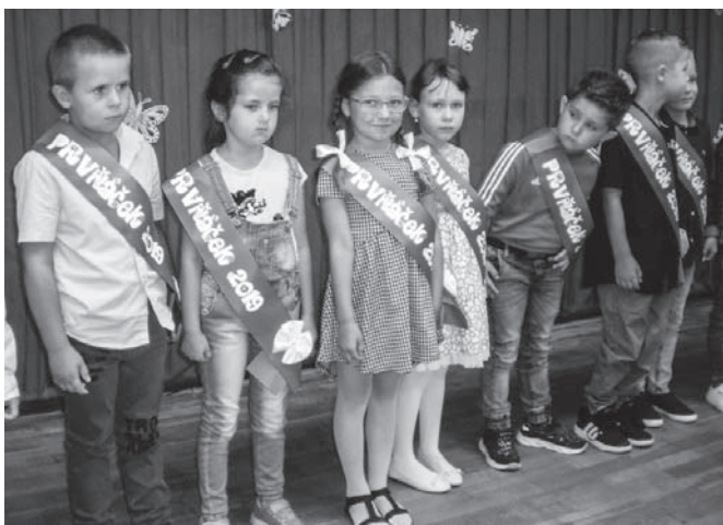
Ošerpování prvňáčci při zahájení nového školního roku.