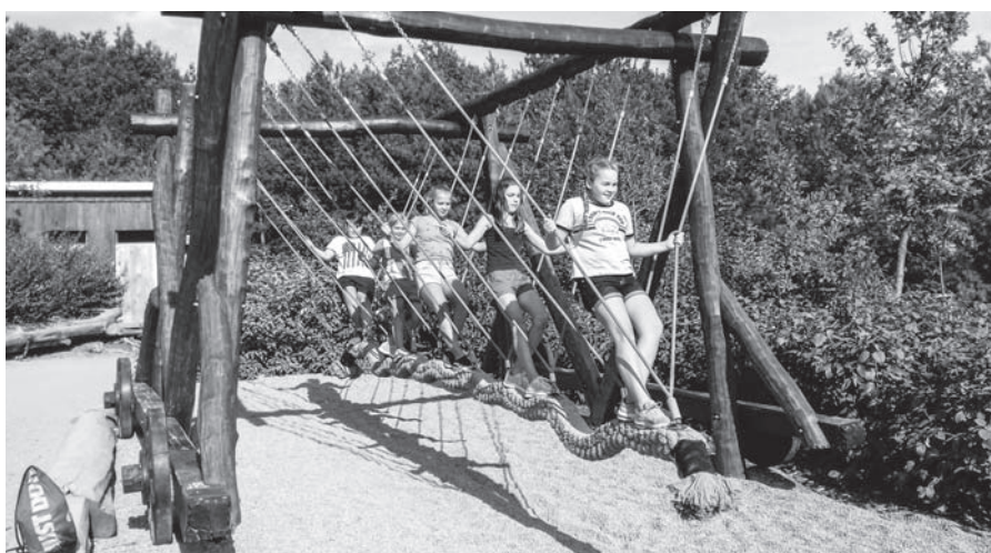
Hromadná houpačka v Mirákulu u Milovic.