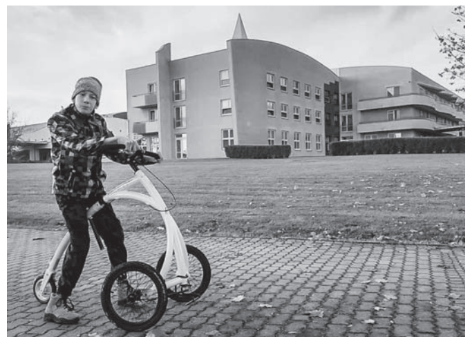
Odrážedlo usnadňující pohyb.