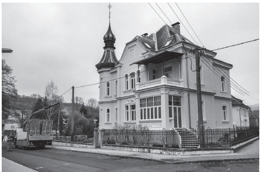
Oprava fasády domu v Zahradní ulici.

V průběhu letních a podzimních měsíců se uskutečnily velké opravy čtyř obecních bytových domů.