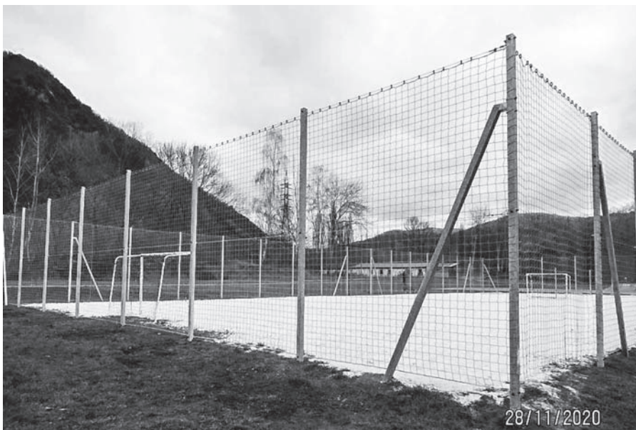
Nové oplocení hřiště v pískovně.

Během měsíce října zkrášlilo okolí naší obce více než dvacet nově vysazených stromů. Šestnáct vzrostlých stromů lemuje od října chod-