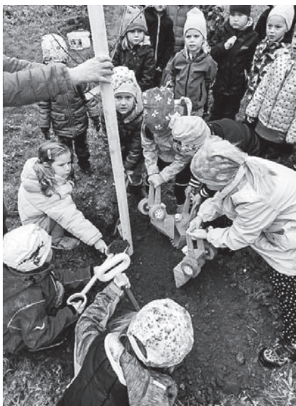
Předškoláci sázejí třešň.

ve školce udělat příjemnou vánoční atmosféru. Opět však budeme muset oželit společné vánoční tvoření s rodiči a třídní besídky.