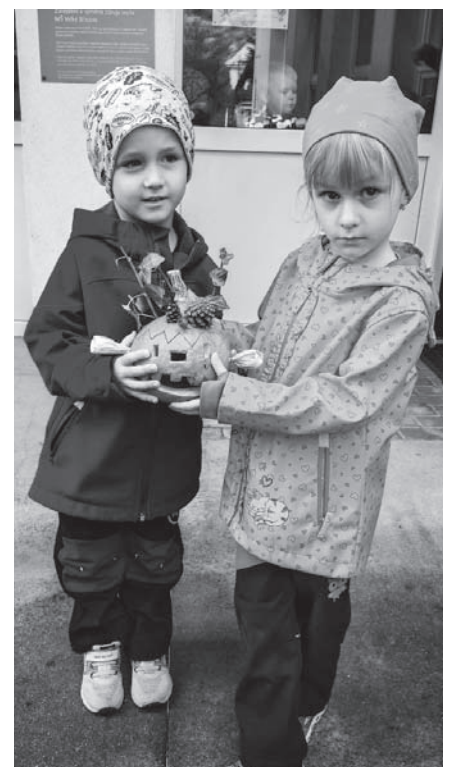
Společná práce dětí z mateřské školy

Děti nepřišly ani o „Mikulášské zvonění“, zakoupili jsme kostýmy Mikuláše, čerta a anděla a připravili pro děti program i s nadílkou. Navzdory všemu se pokusíme dětem