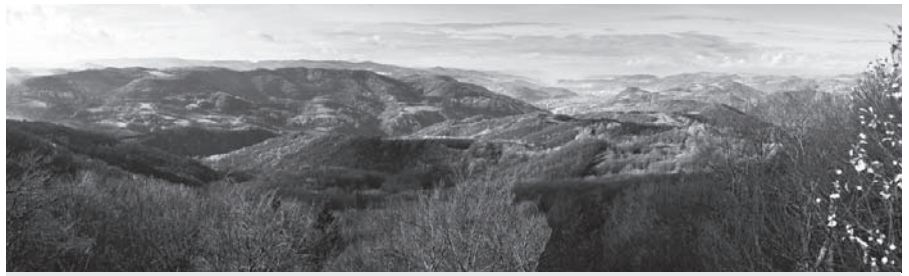
Kouzelný výhled do údolí Labe z Humboldtovy vyhlídky na Bukové hoře.