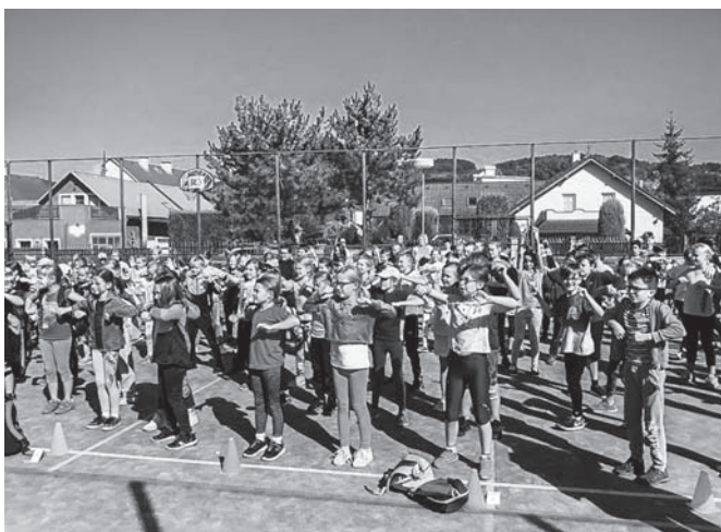
Osmý ročník Sazka olympijského víceboje.

V srpnu 2020 se rozvolňovala protiepidemiologická opatření v celé společnosti, lidé se vraceli z Chorvatska, několik mých známých si zajelo do Itálie... Pro velkobřezenské