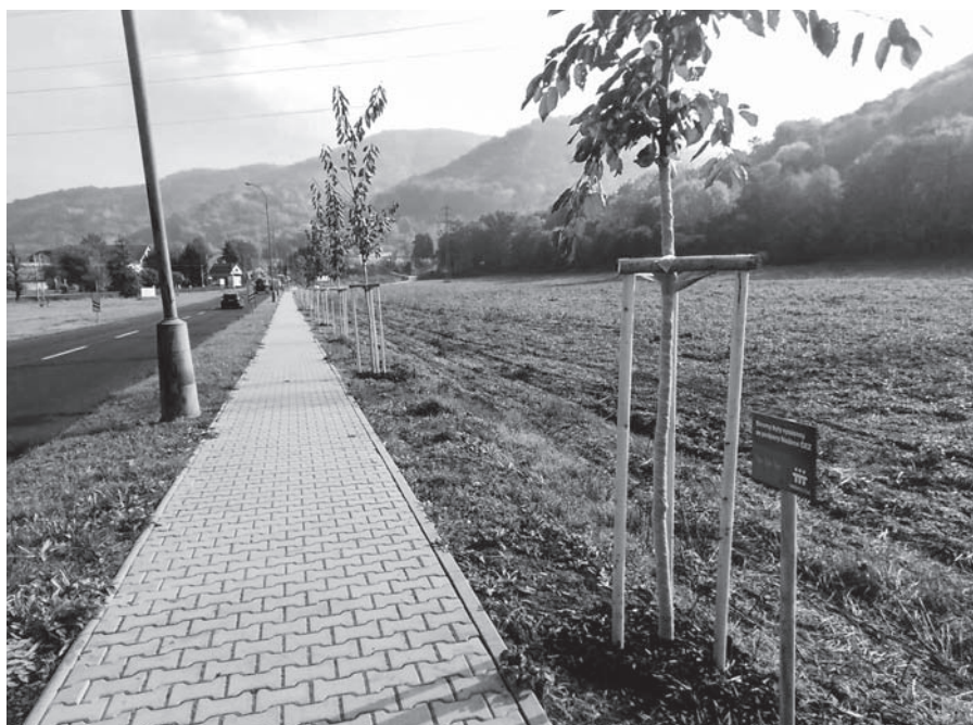
Nové třešňové stromořadí vysázené díky Nadaci ČEZ a jejího grantu Stromy.

Od září, kdy se pomalu začala situace opět zhoršovat, bylo jasné, že z konání dalších akcí zřejmě sejde. A následující vývoj to jen potvrdil. V říjnu tak odpadl lampiónový průvod a nako-