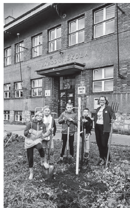
Akce 72 hodin.