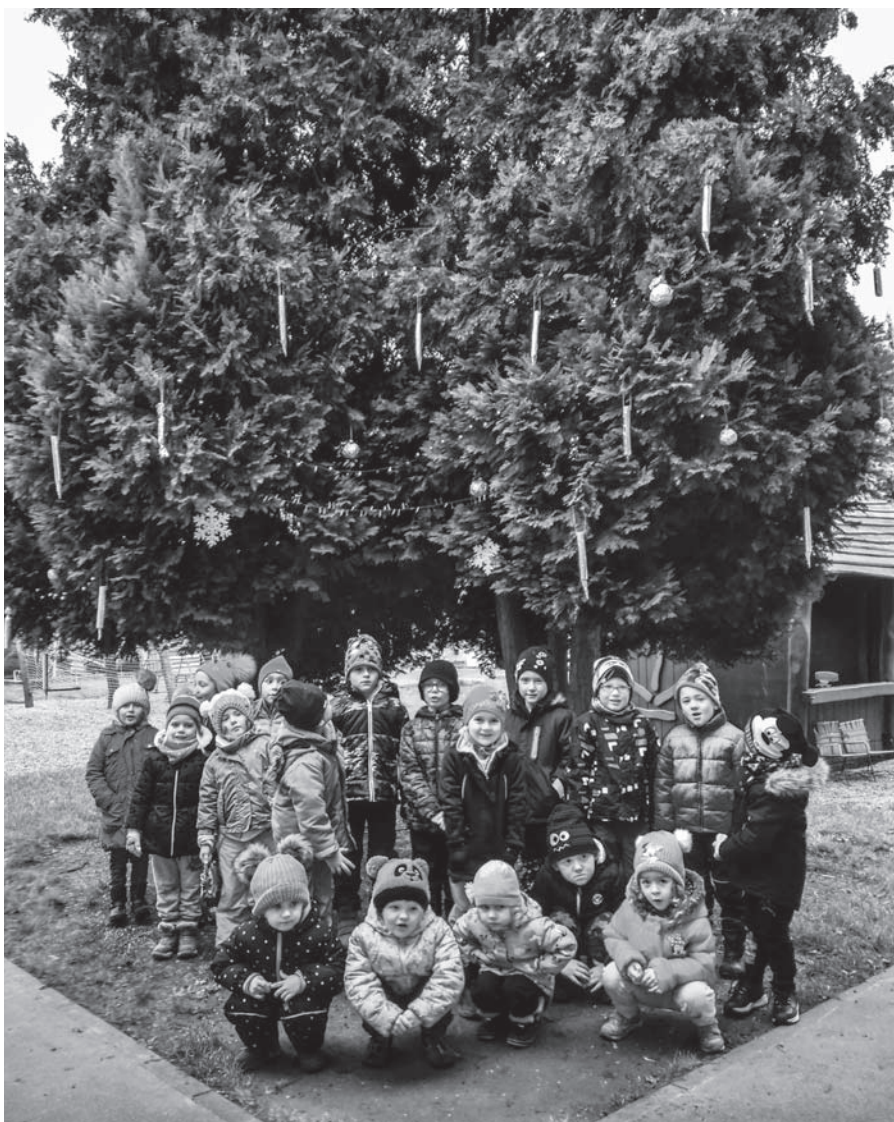
Děti z mateřské školy pod ozdobeným a nasvíceným vánočním stromem.

ve školce udělat příjemnou vánoční atmosféru. Opět však budeme muset oželit společné vánoční tvoření s rodiči a třídní besídky.