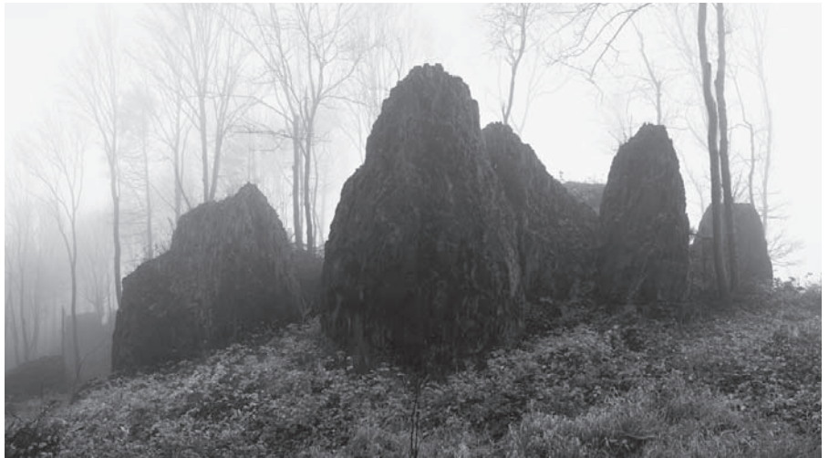
Věže skalního města na Bukové hoře mají za mlhavého počasí tajemnou atmosféru.

Řešení tajenky osmisměrky je uvedeno ve spodní části této stránky.