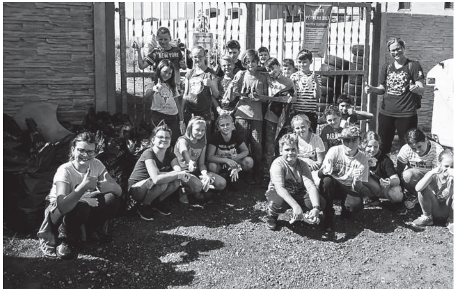
Společné foto účastníků akce Uklidme Česko.