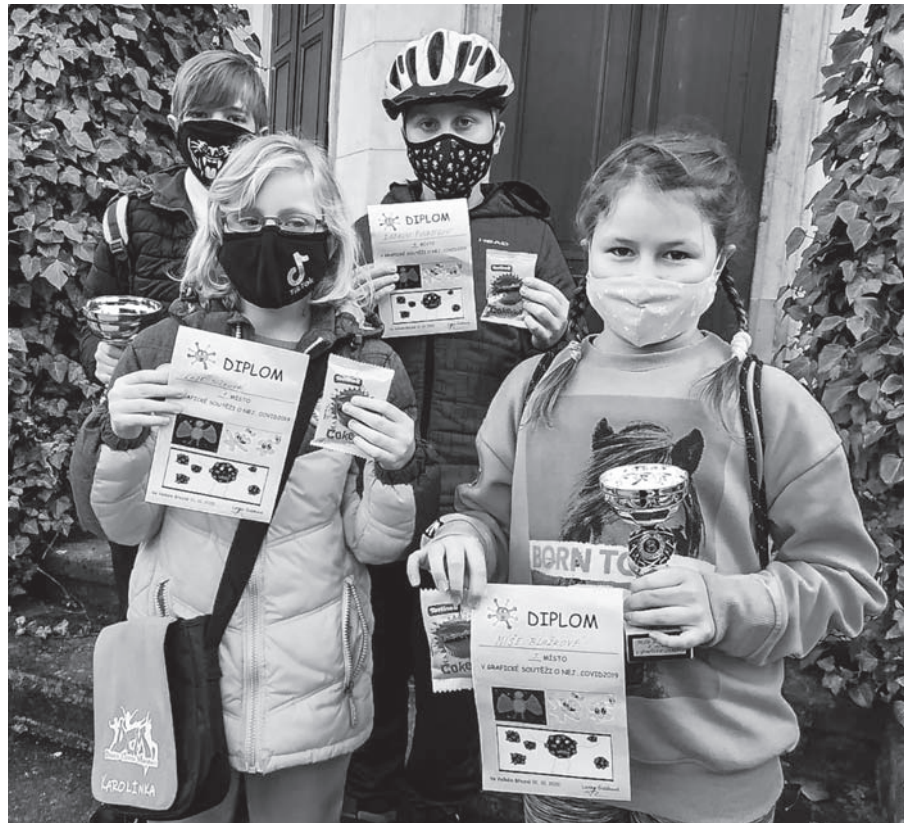
Předávání ocenění na zámku za kresby „covidáku“.

Podzim nemám ráda, protože musím hrabat listí, je mlha a nemůžu si hrát s tátou, protože jde topit a to mu trvá strašně dlouho.