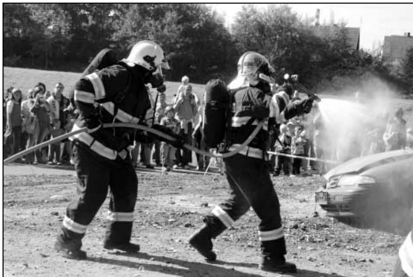
Ukázka akce našich hasičů na pouti.