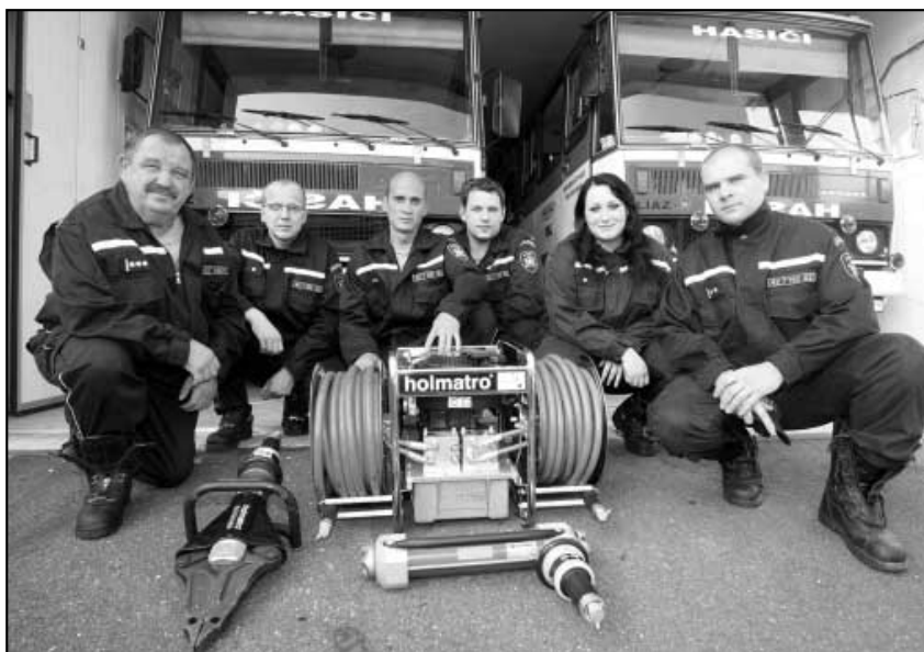
Zakoupení nového vyprošťovacího zařízení.

2x k námětovému cvičení - obchodní řetězec OBI Ústí nad Labem, cvičení na hradě Střekov.