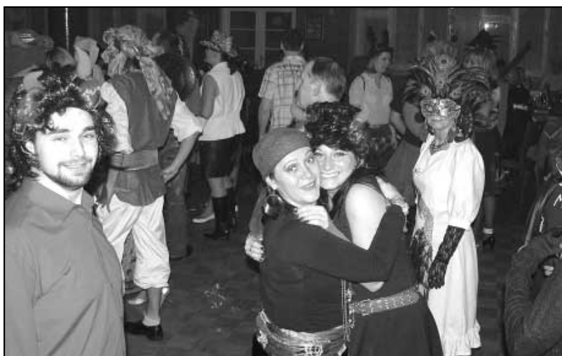
Jedna z mnoha úspěšných kulturních akcí, které připravují naše ženy.

Tento fond akceptoval i naši žádost o (Pokračování na str. 2)