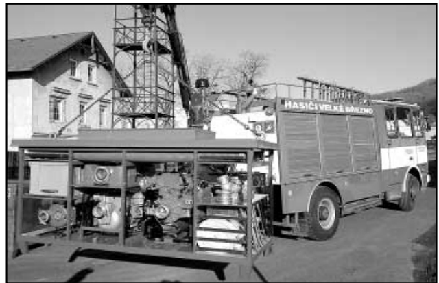
Přestavba kontejneru vozidla TA4, kterou provedl Patrik Panocha

Ve zdokonalovací činnosti se uskutečnila 3 školení mužstva na základně v rozsahu 10 hodin, za účasti 8,4 a 7 hasičů, dále školení na HZS v Ústí nad Labem zaměřené na použití vyprošťovacího zařízení. V údržbě a péči o svěřené