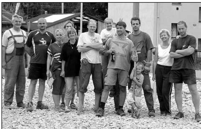
Toto jsou skvělí brigádníci z řad našich obyvatel při práci na dětském hřišti.

Opět využívám této příležitosti a ráda bych upozomila všechny občany, kteří doposud ještě nezaplatili poplatek za odpady aby tak učinili do 26.10.07. Libuše Pokorná Obecní úřad Velké Březno