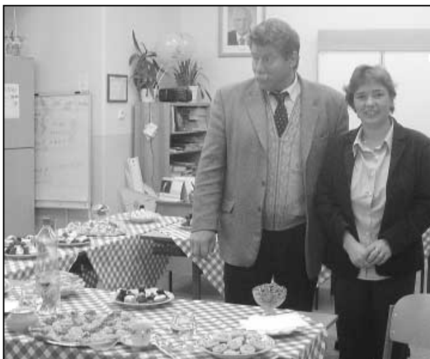
Den otevřených dveří 9/2007

Začátek školního roku byl ve znamení již 8.ročníku této sportovní soutěže. 2 smíšená družstva chlapců a dívek si poměřila síly se žáky speciálních základních škol Ústecka ve 4 disciplínách