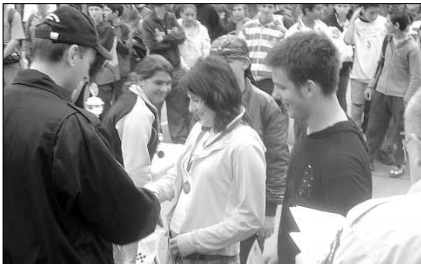
Branný závod O pohár městské policie 9/2007

Ve školním roce 1966-1967 školu již navštěvuje 33 žáků ve 3 třídách, k dis-