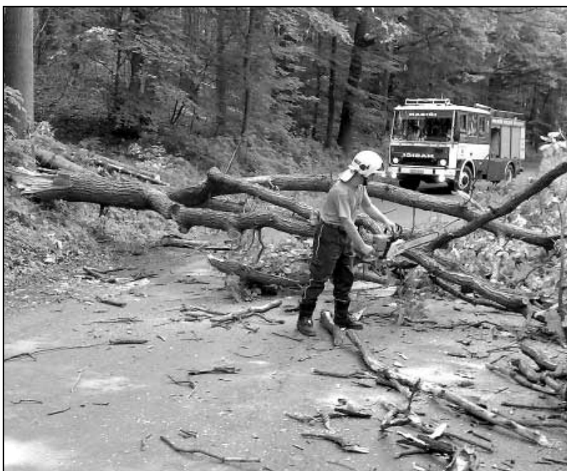
Dobrovolní hasiči z Velkého Března v akci. Čtěte uvnitř zpravodaje.