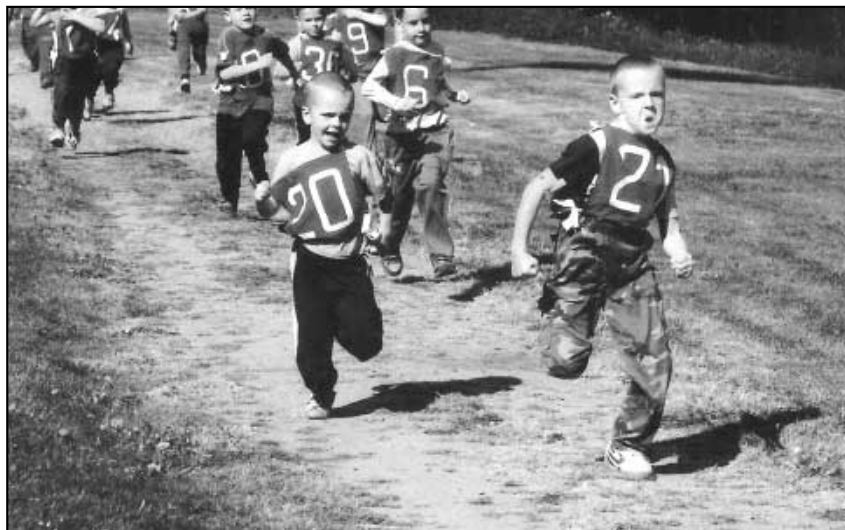
Běh Zámeckým parkem.

Všem dětem a rodičům přejeme hezké, radostné a spokojené prázdniny a dovolenou. MŠ Velké Březno