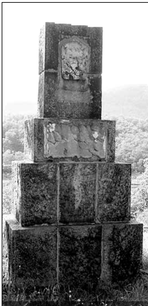
Stejný pomník vyfotografovaný po 61 letech.