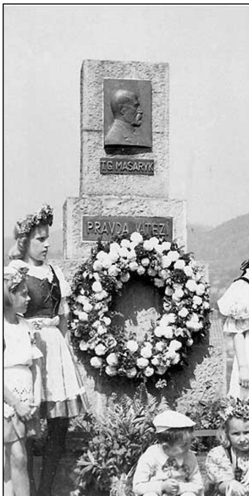
Fotografie zachycuje znovuoobnově pomníku T.G. Masaryka dne 19. 5. 1946 ve Valtířově.