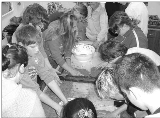
Projektový týden věnovaný ekologii jsme zakončili Dnem země. Žáci byli rozděleni do 4 skupin, každá z nich plnila úkoly na jednotlivých stanovištích. PET láhve jinak - děti vyráběly z plastových lahví různé výrobky, Třídíme odpady - soutěže s tematikou třídění odpadů a Strom života - aktivita spojená s českým jazykem (komunikační a slohovou výchovou). Na závěr dne žáci společně vyráběli ruční papír.