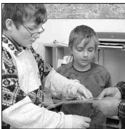
Před velikonoce jsme uspořádali výtvarné a pracovní dílny, kde si každý mohl vyzkoušet uplést pomlázku, naučit se nové techniky zdobení vajíček a ozdobit si velikonoční perníčky.