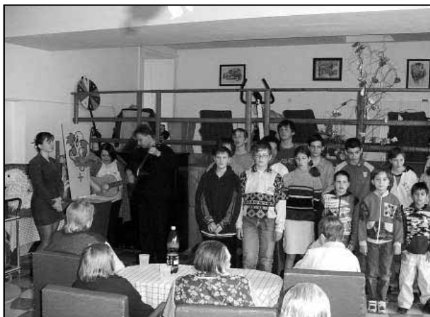
V dubnu před velikonoce žáci vystoupili s programem lidových písníček v Domově důchodců ve Velkém Březně.