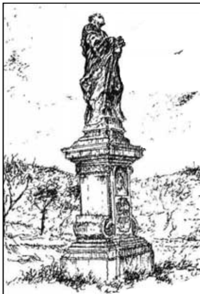
Socha sv. Petra