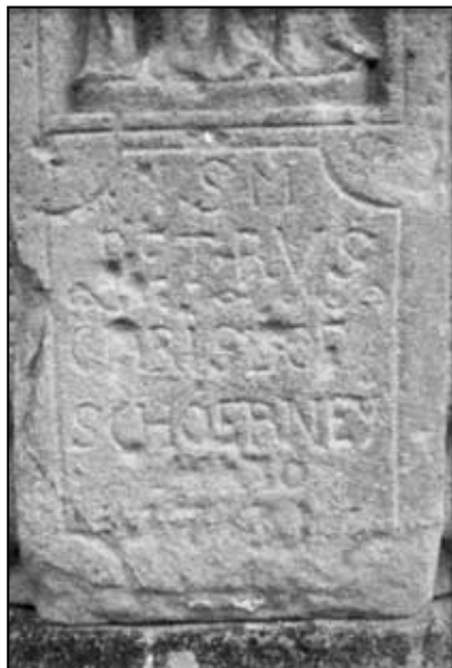
Podstavec velichovského křížku