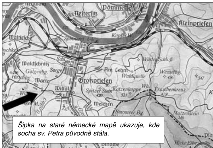
Šipka na staré německé mapě ukazuje, kde socha sv. Petra původně stála.